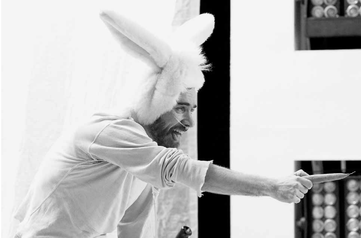
Over my Dead Body de Dave St-Pierre, présenté à Tangente en janvier 2009.

croitait « intolérablement voyeuriste », détaillant aussi en quoi un tel « art de la victime » rendrait impossible son travail de jugement esthétique.