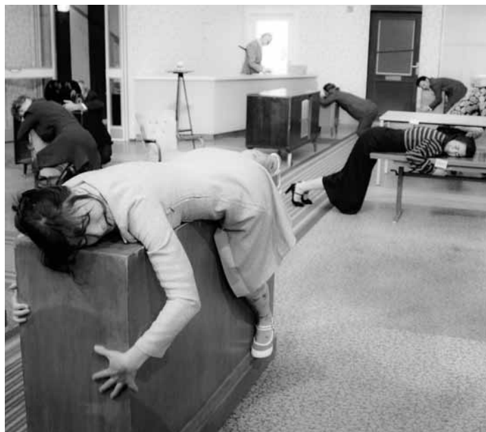
Riesenbutzbach. Eine colonie permanente de Christoph Marthaler, présenté à Avignon en 2009.