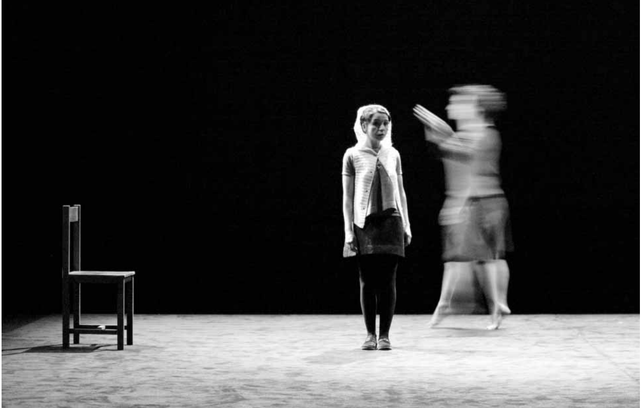
Le Petit Chaperon rouge , écrit et mis en scène par Joël Pommerat (Compagnie Louis Brouillard), présenté à l'Usine C en novembre 2008.