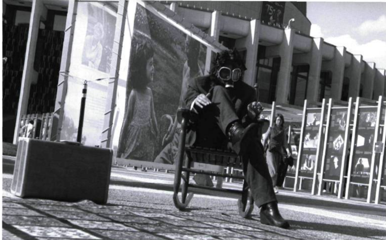
Zone, chorégraphie de Sonia Lareau, l'une des performances de l'événement The Art (prononcez dehors) II : le retour, présenté sur l'Esplanade de la Place des Arts en septembre 2008. Sur la photo : Indiana Escach.