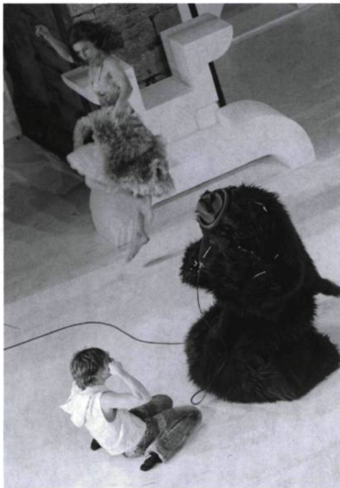
Le Bazar du homard de Jan Lauwers, présenté au Festival d'Avignon 2006.

fil a eu un accident, et voilà l'intrigue lancée à toute allure dans les méandres d'un esprit perturbé. À la manière d'un polar, la fable est déconstruite. Tous les interprètes, simultanément récitants et protagonistes, sont au service de ce récit monstrueusement kitsch (costumes, emprunts à la comédie musicale). Il y a une énergie folle, une manière d'être porté par le collectif et par la musique, une danse qui se moque mais qui s'assume aussi, une danse comme la seule expression possible d'un désarroi (le solo de la mère, perdue dans sa tristesse, s'accrochant dans ses chutes à son mari ou au fils qu'elle retrouve, enlace, embrasse un instant); et ces ruptures pendant lesquelles tous dansent ou qui voient certains danser en toile de fond, en parasitage ou en accompagnement de l'action scénique. Lauwers, qui signe aussi le texte, déploie une magnifique conduite de l'ensemble, une narration qui use de tout et ne fait jamais étalage. Une leçon magistrale et une proposition qui associe une fable à du théâtre avant-gardiste, réinventant d'autres narrations. Un spectacle qui, tout en parlant de désarroi, est d'une joie incandescente. Un magnifique pied de nez aux remous de l'édition 2005. j