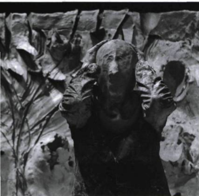
Paso Doble de Miquel Barceló, présenté au Festival d'Avignon 2006.

école du spectateur, un lieu d'échange, de tribune, dont il existe peu d'équivalent. Conférences de presse publiques, discussions spontanées, dédicaces, lectures, expositions, rencontres thématiques regroupant artistes, chercheurs, administrateurs, qui sont autant de regards sur l'histoire du Festival que de clés pour aborder la création d'aujourd'hui.