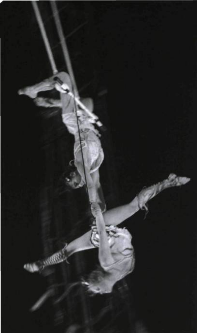
Ola Kala , spectacle des Arts Sauts, présenté à la Tohu à l'été 2006.