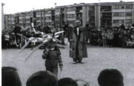
Clowns Sans Frontières au Kosovo en mars 2000.

Les clowns déclenchent parfois même sous leurs yeux ce que l'on pourrait appeler des miracles, là où la vie s'impose, plus forte que tout. Cette petite fille qui avait été attachée une bonne partie de son enfance, qui n'avait pas de contact avec l'extérieur et avait sombré dans une forme d'autisme, s'est réveillée après le spectacle et a recommencé à jouer avec les autres enfants. Et ce petit garçon qui était en fauteuil roulant, ne regardant jamais personne, il a ri, cette fois-là ! Et cette autre qui jongle aujourd'hui à sept balles... Bien des petites histoires, autant de grandes merveilles et, pourtant, il s'agit simplement de rendre à ces enfants ce que les horreurs de la guerre leur ont volé : le rire et la joie de vivre.