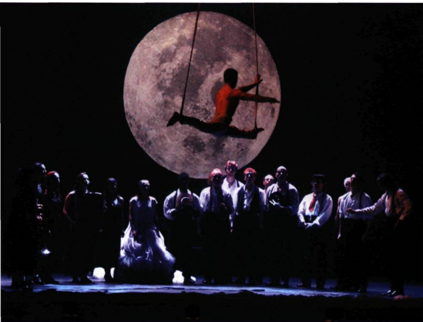
Nomade , mis en scène par Daniele Finzi Pasca (Cirque Éloïze, 2002).