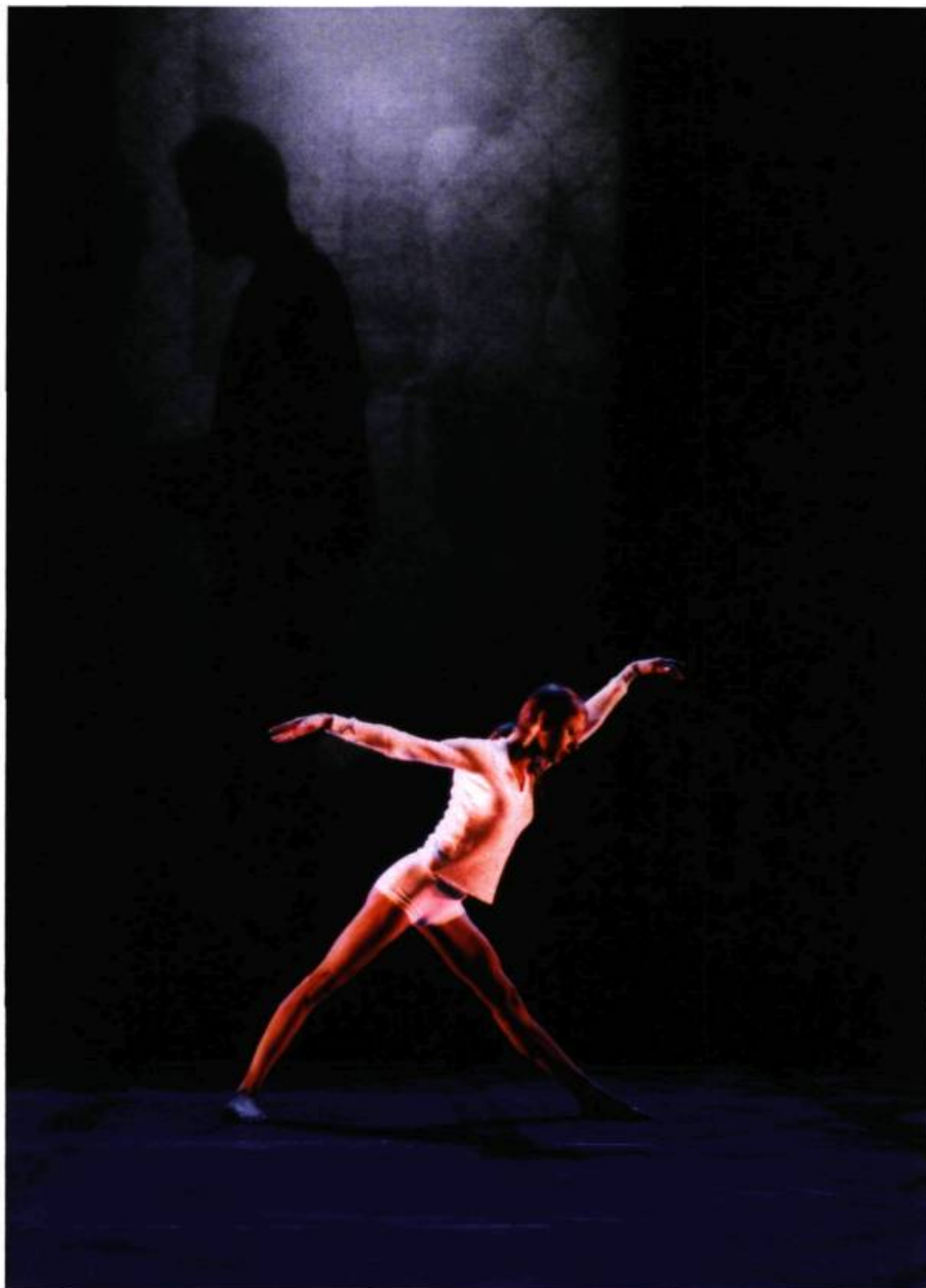
5 Heures du matin , conçu, mis en scène et chorégraphié par Paula de Vasconcelos (Pigeons International, 2005). Sur la photo : Milene Azze.