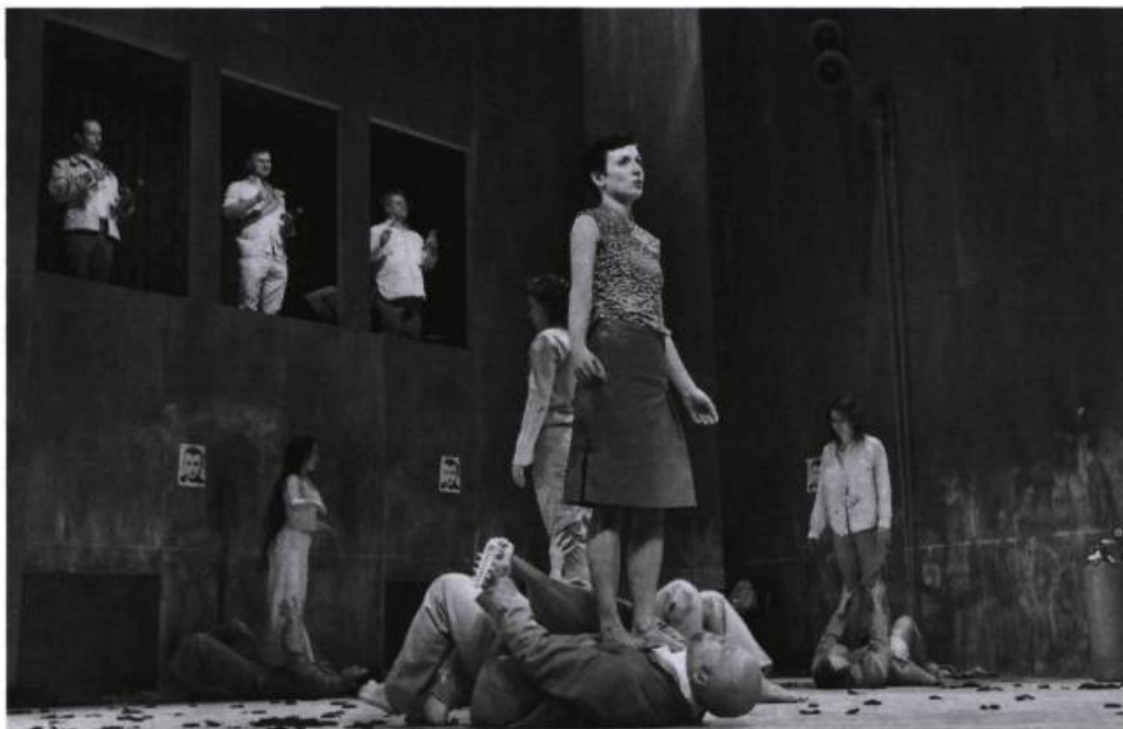
Foi de Sidi Larbi Cherkaoui, jeune chorégraphe invité par la compagnie C. de la B., en résidence au Vooruit. Le spectacle a été présenté à Montréal, au Centre Pierre-Pélaudeau, par Danse Danse.

L'école propose un cycle de deux fois deux ans, « training » et « research ». Un étudiant peut entrer dans l'un des deux cycles, mais la plupart suivent les deux premières années. Choisis parmi 700 candidats, certains y arrivent sans formation en danse, mais les exigences sont élevées et portent sur « l'intelligence du corps, la présence charismatique, la capacité d'absorber très vite une information, les dispositions