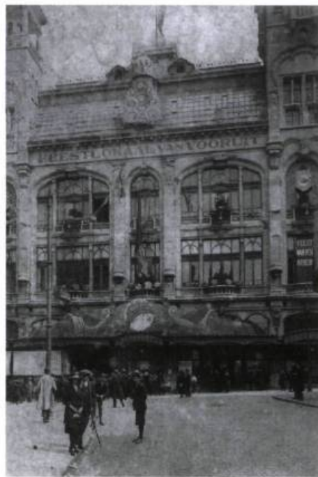
L'édifice du Centre d'arts Vooruit à Gand (Belgique), construit par le mouvement ouvrier socialiste dans les années 20.