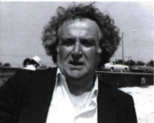
Marcel Dubé en 1982.

L'aventure d' Un simple soldat m'apparaît importante à plusieurs égards. C'est l'un des premiers, sinon le premier grand téléthéâtre québécois, présenté comme les grandes productions de Dostoïevski, Tchekhov, Racine, Molière et Beaumarchais. L'impact de sa diffusion a été impressionnant. L'immense majorité des gens se sont reconnus dans le mal de vivre de Joseph, dans sa quête d'absolu qui lui donne un côté suicidaire. La seule fin que Joseph peut concevoir, c'est celle du soldat qui meurt bravement au front. Cette image appartenait à notre inconscient collectif, tout comme notre sentiment d'impuissance. Les gens ont aimé se reconnaître et, jusqu'à un certain point, se retrouver psychanalysés. Parce que c'est bien ce que Dubé a réussi à faire : montrer l'inconscient collectif d'un peuple comme le nôtre, conquis, aliéné dans ses aspirations et dans sa langue. Je crois que chez ceux qui disaient ne pas avoir aimé le téléthéâtre, qui n'y trouvaient que du misérabilisme, le choc de la reconnaissance avait été le même, mais qu'ils refusaient ce qu'ils avaient vu. Dubé n'a toutefois pas