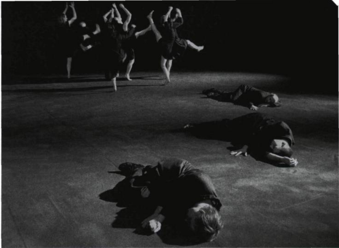
L'Exil-l'Oubli de Jean-Pierre Perreault.

groupes compatibles. Il possédait ainsi un art proprement musical des microruptures, des syncopes, des répétitions dans la composition.