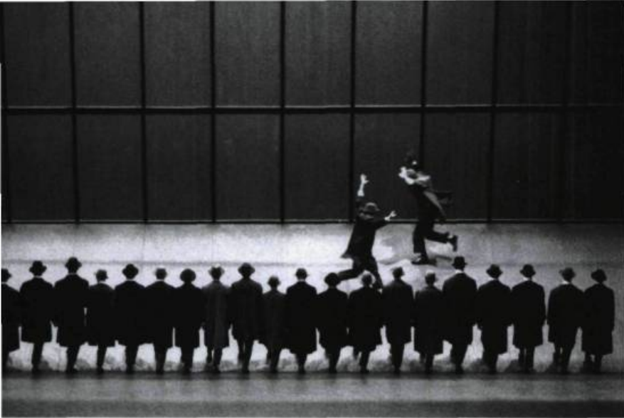
Joe (1983) de Jean-Pierre Perreault.

jet qu'a la culture de durer est relancé comme l'espoir d'y parvenir. Puisse la danse québécoise contemporaine continuer de s'y inscrire.