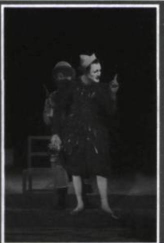
Annie Fratellini et Pierre Étaix.

Certains hommes de théâtre recherchent la participation du public, alors que, pour le clown, elle est naturelle. Il n'est pas au-dessus du public, mais dans le public. Dans le rond de la piste, il doit créer une autre dimension. Créer son décor avec rien, se faire admettre d'emblée. Dès le moment où le clown entre en action, il doit être vérité, liberté. Le cirque est un art qui nécessite, au même titre que le théâtre, une mise en piste soigneusement élaborée.