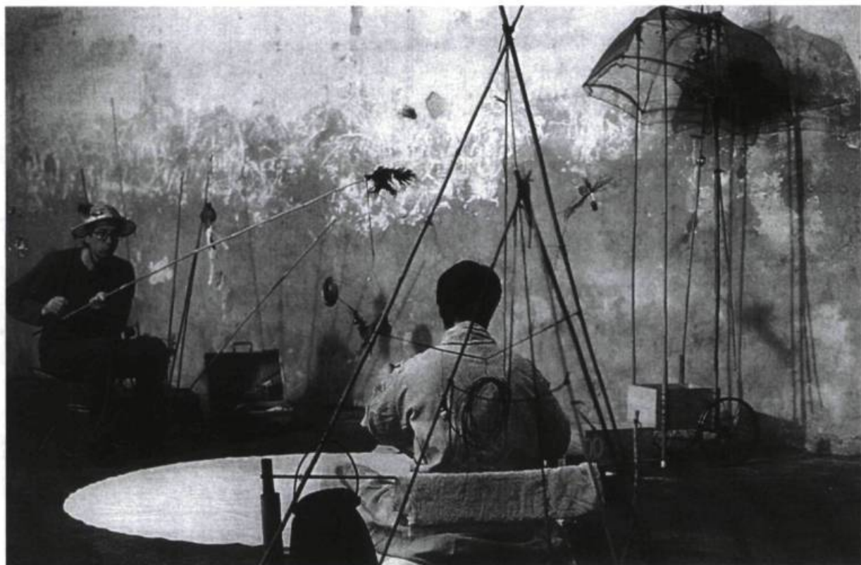
Trois Petits Chantiers , spectacle de la compagnie française Agitez le Bestiaire, présenté à la Maison Théâtre à l'automne 2001.