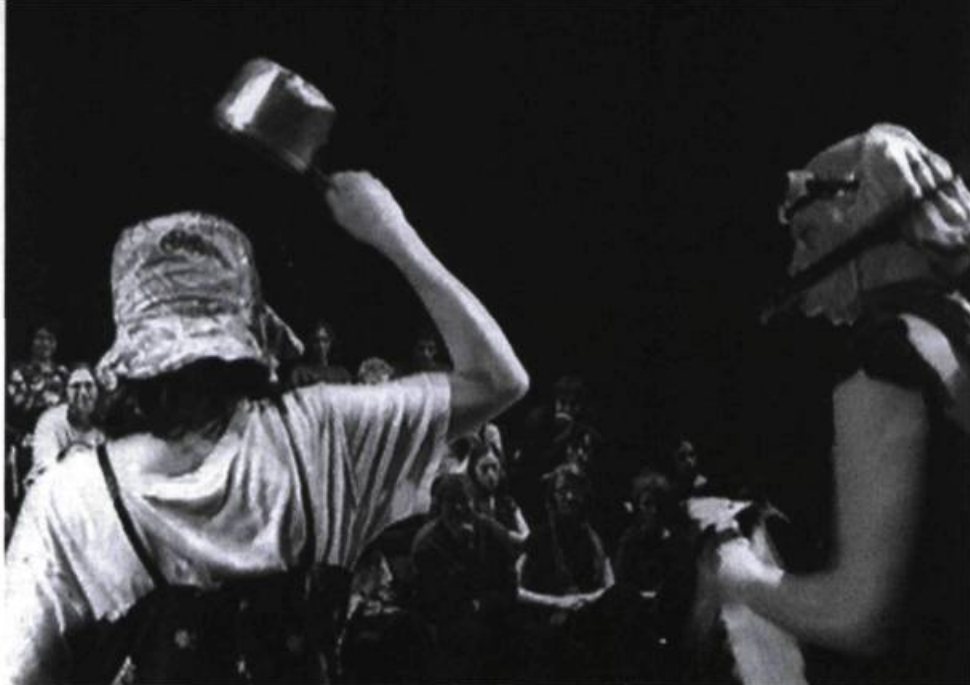
Voisins , conception et mise en scène de Robert Faguy (Arbo Cyber, théâtre (?), 2001).