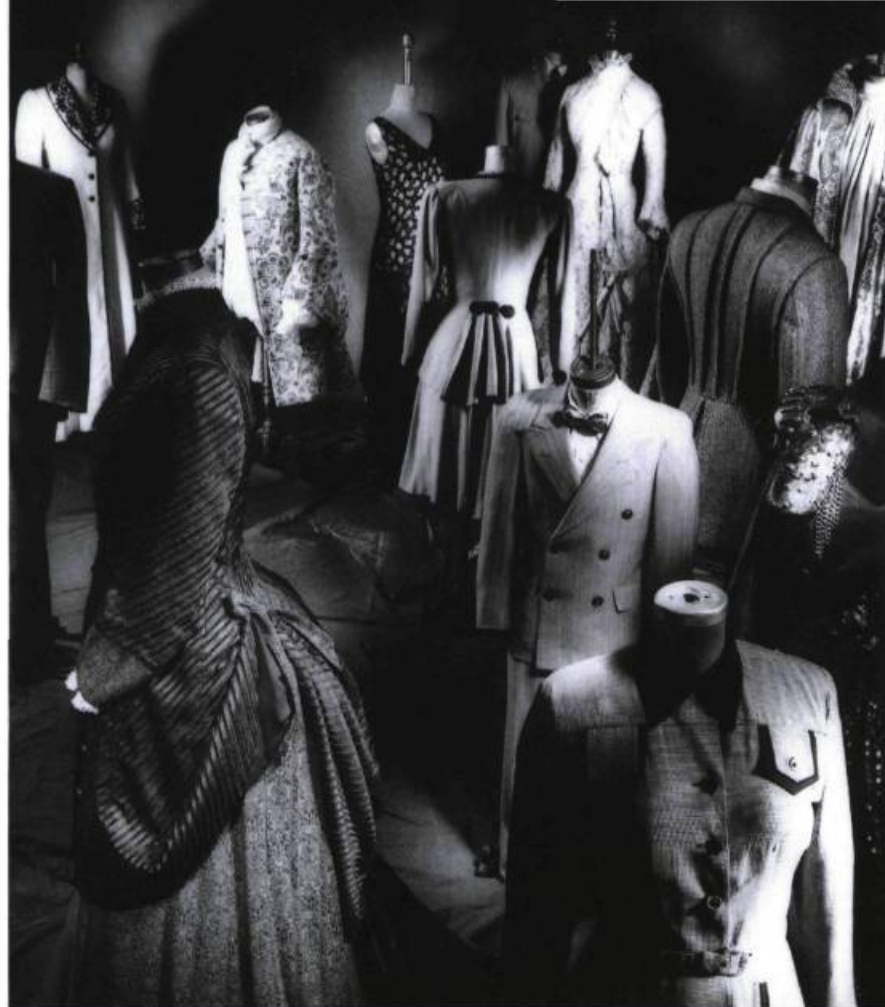
Aperçu de la collection du CNC.