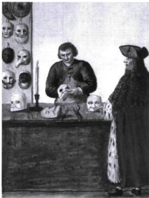
Boutique de mascarero, artisan du masque, à Venise. Aquarelle de Giovanni Grevenboch (XVIII e siècle).

c'est-à-dire « masques, perruques, postiches, prothèses, maquillages et même accessoires tels que bijoux, décorations, armes ». Pourtant, le long développement qui suit, étalé sur seize colonnes de texte, ne s'intéresse au costume que dans le sens restrictif d'« habit » (c'est aussi la démarche adoptée par Patrice Pavis dans son dictionnaire 2 ), et la plupart des « éléments visuels » précités sont laissés pour compte. Une consultation plus poussée du Corvin montre que ni « postiche » ni « prothèse » n'ont d'entrée propre, et que « perruque » est expédié en quelques lignes. « Accessoire » renvoie curieusement à « Objet » (intitulé en réalité « Objet théâtral »), article dans lequel le mot « costume » ne figure même pas ! Le lecteur sera un peu plus chanceux avec « Maquillage » et « Maquillages (en Chine) » mais, aussi, quelque peu déçu de constater que les rapports entre maquillage et masque sont ignorés. Les articles « Masque », « Masque (genre dramatique) » ou « Masque antique » ne nous