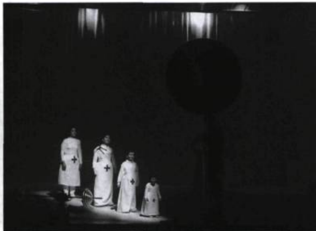
Deux spectacles de la Societas Raffaello Sanzio (Italie) étaient présentés au Festival d'Automne à Paris 2000 : Il Combattimento (ci-dessus) et Genesi (à droite).