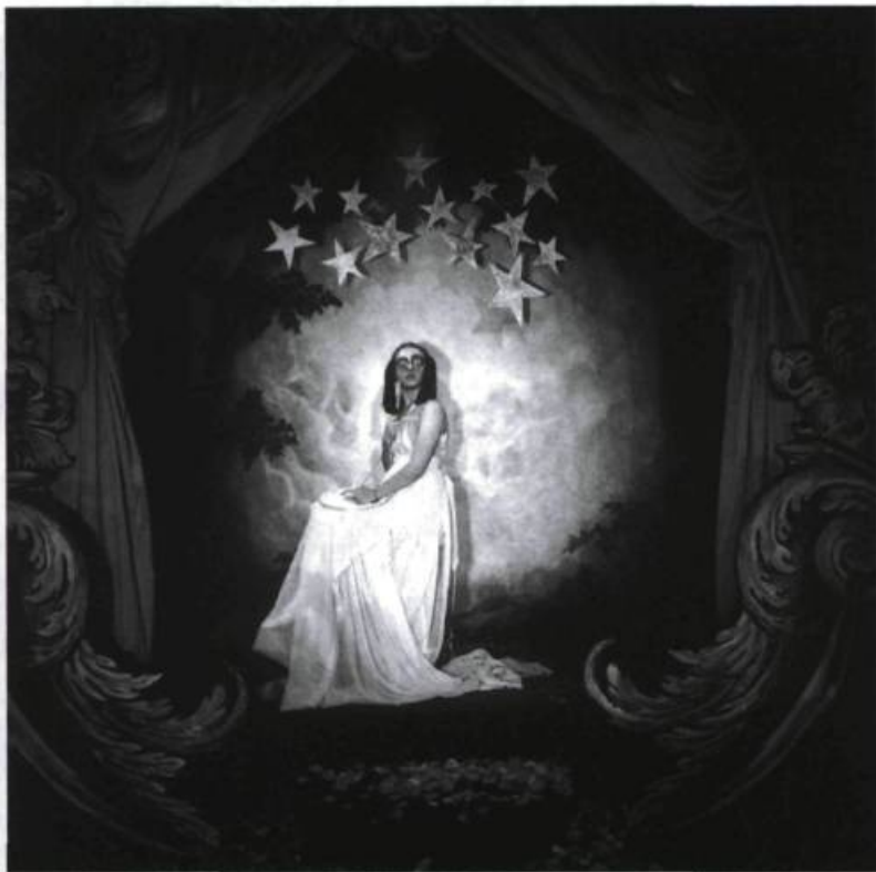
Petits Miracles misérables et merveilleux de Claudie Gagnon (2001).

Ce qui contribue sans doute à ces expérimentations et décloisonnements tient sans doute aussi au fait de la petite taille de la place artistique québécoise : rarement ailleurs, je n'ai eu cette sensation que les interprètes et les projets évoluaient dans un milieu restreint. À chaque spectacle que je vois, je retrouve comédiens, metteurs en scène, journalistes, autant de figures connues qui se croisent et sont à même de se connaître ; la notion d'appartenance à une troupe fermée, permanente, n'est pas