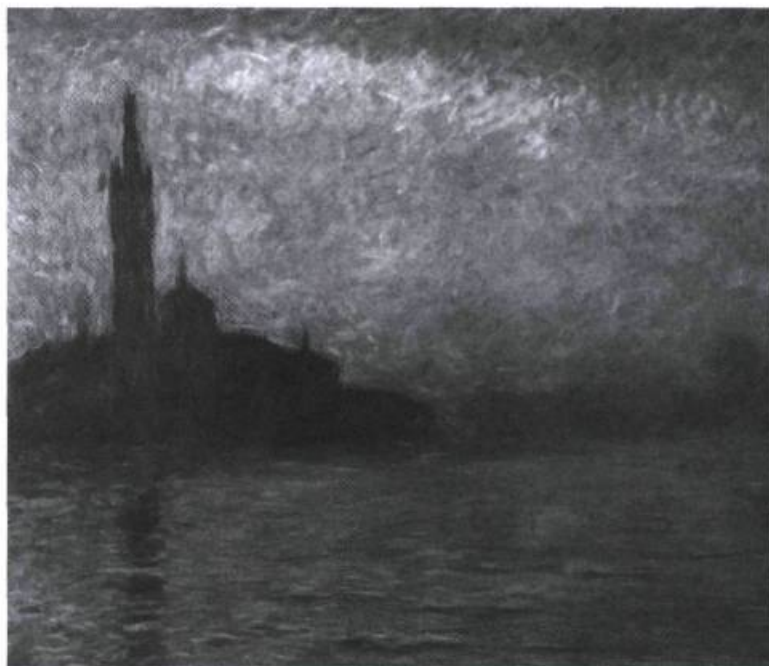
« [...] l'impressionnisme avait voulu faire tenir dans un paysage toute la magie lumineuse de l'instant [...] » Claude Monet, Crépuscule, Venise , 1908. Huile sur toile. (Tokyo, collection Ishibashi.)

Le théâtre s'est mieux reconnu en tant qu'art du temps lorsqu'il s'est arraché à l'impérialisme du texte, autrefois objet d'attention exclusif. Autrefois – c'est-à-dire, en gros, jusqu'à la fin du XIX e siècle –, parler théâtre, c'était parler texte. Et le texte ne pouvait être porté que par les comédiens (le vedettariat, un des aspects les plus lucratifs de l'industrie culturelle moderne, a, en fait, un beau passé). Il n'était pas alors question de metteur en scène ; le régisseur, qui n'était souvent que le directeur de théâtre, suffisait à tout. Mais, en même temps que l'électricité commençait à réorganiser la vie quotidienne, le metteur en scène faisait son apparition. Avec lui, le théâtre vivant devait coïncider de plus en plus avec le spectacle, s'accomplissant dans une manifestation intense et brève comme une jouissance. Le texte dramatique, dans sa forme