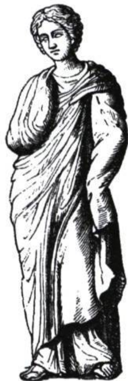
Mnémosyne, mère des Muses. Illustration tirée de Mythologia. Dictionnaire illustré des mythologies de Myriam Philibert, Paris, Actualité de l'Histoire, 1997.

L'impression qu'éprouve chacun des spectateurs d'une salle de n'être qu'un élément d'un ensemble, ce sentiment flottant d'une saisie individuelle parmi d'autres, d'une relativité absolument miennne, manque au théâtre filmé. Le théâtre n'est pas compatible avec l'image cinématographique peut-être parce qu'elle est une « image-temps », comme l'a démontré Deleuze, même si certains cinéastes ont réussi de beaux exploits en la matière. En fin de compte, il s'est avéré que la caméra ne pouvait rendre de l'expérience théâtrale qu'une version adultérée, même si, pour les fonds d'archives, elle est d'un apport précieux. On pourrait en dire