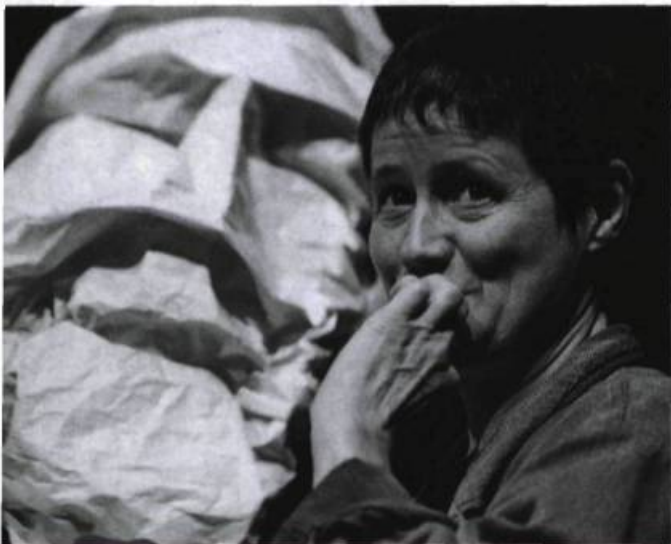
Histoires de visages de Horta van Hoye (Suisse), spectacle invité aux Coups de théâtre 2000.

vibrant, grinçant quand il faut, son récit nous emballait juste assez pour soulever le public et le contrôler à volonté, comme hypnotisé, dompté, apprivoisé. Le thème de la faim touche encore beaucoup nos enfants. Nos petits urbains connaissent son impatience, son urgence, sa gravité. Et ils s'éveillent à son pendant, la gourmandise des bonbons sucrés, colorés, attirants à souhait. L'eau vient à la bouche, quand on évoque avec talent les délices du palais. En l'occurrence, c'est le musicien qui se goinfre, pendant que les petits du conte meurent de faim : ce gag tout simple mais très efficace n'a pas passé inaperçu. Et puis, n'y a-t-il pas, toujours lovée, la crainte d'être dévoré, croqué par la méchanceté, par l'inconnu de la forêt, par la sorcière noire, par la cuisinière obsédée de friture grasse, de four brûlant et de déjeuner copieux ? Les enfants ne veulent pas être pris dans des cages, même pas le temps d'une histoire : il leur faut une délivrance prompte, un ailleurs meilleur, un soulagement à cet appétit qui exige son dû, comme l'ogre le sang, le loup le Chaperon et la grand-mère, le Minotaure son lot de jeunes gens. Le sacrifice de l'enfant, du fond des âges obscurs, est toujours latent parmi nous.