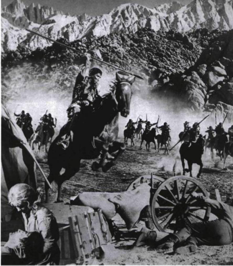
La Conquête de l'Ouest (How the West Was Won, 1962).

un appel à la fraternité universelle, à l'unité de tous.