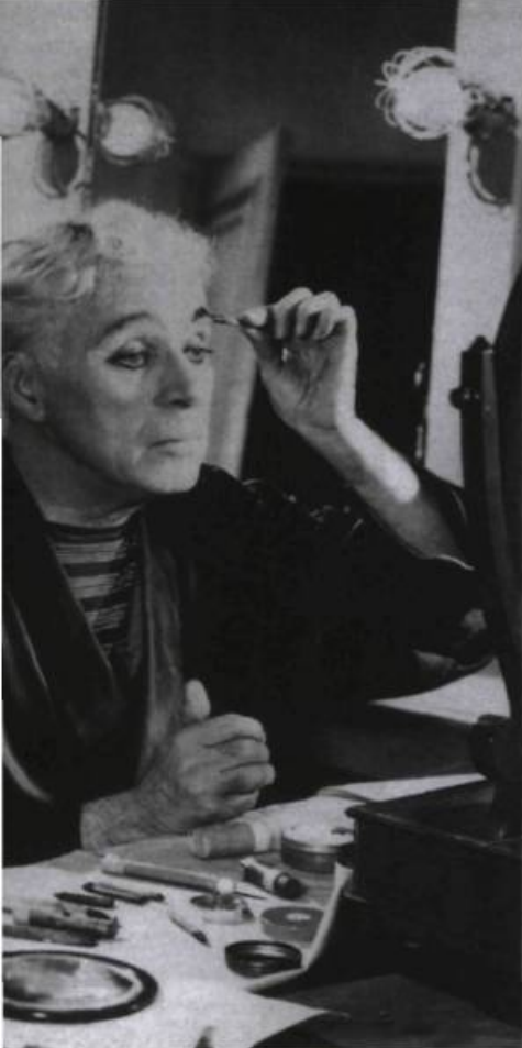
Buster Keaton et Charlie Chaplin se préparant pour leur numéro de pantomime dans les Feux de la rampe ( Limelight , 1953).

Arnold Schwarzenegger Jean-Claude Van Damme Sylvester Stallone