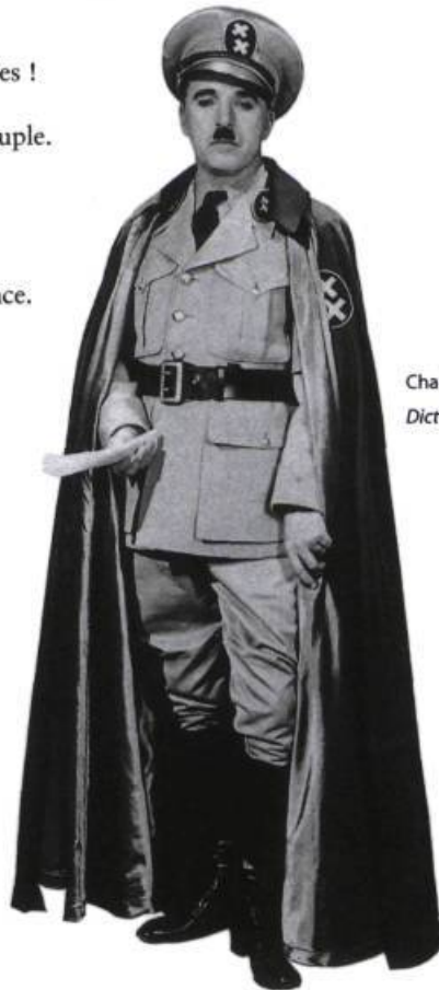
Charlie Chaplin dans le Dictateur , 1940.

Physical theatre, el publico, los actores y los ballarines sobrevivir al s. XX est une commande spéciale du directeur de Teatres de la Generalitat Valenciana, en Espagne. Ce texte a été publié à l'occasion du 8a Mostra Internacional de Mim.