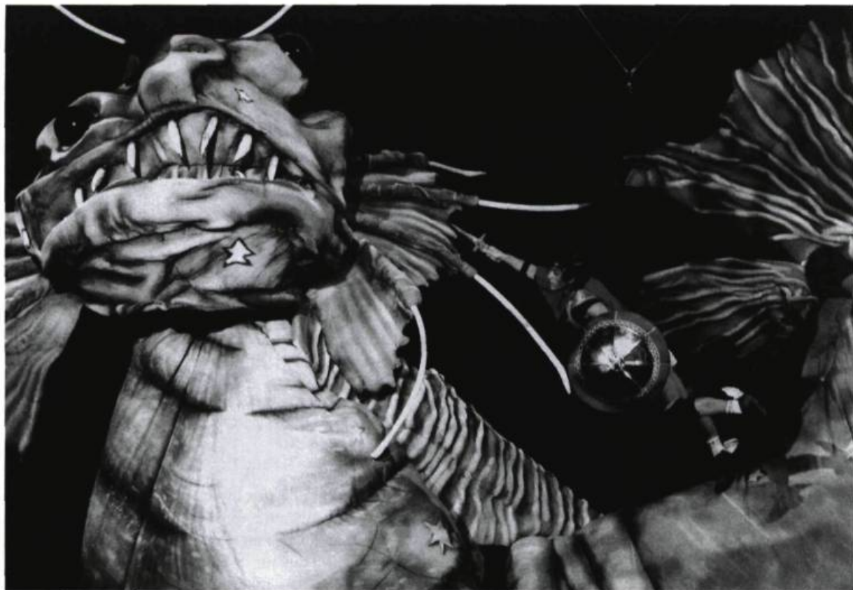
La Route des étoiles, présentée au Théâtre de la Dame de Cœur.