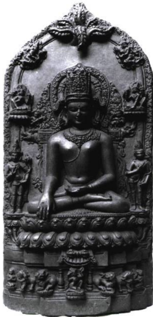
Bouddha paré, XI e -XII e siècle, Inde du Nord-Est. Londres, Victoria and Albert Museum.