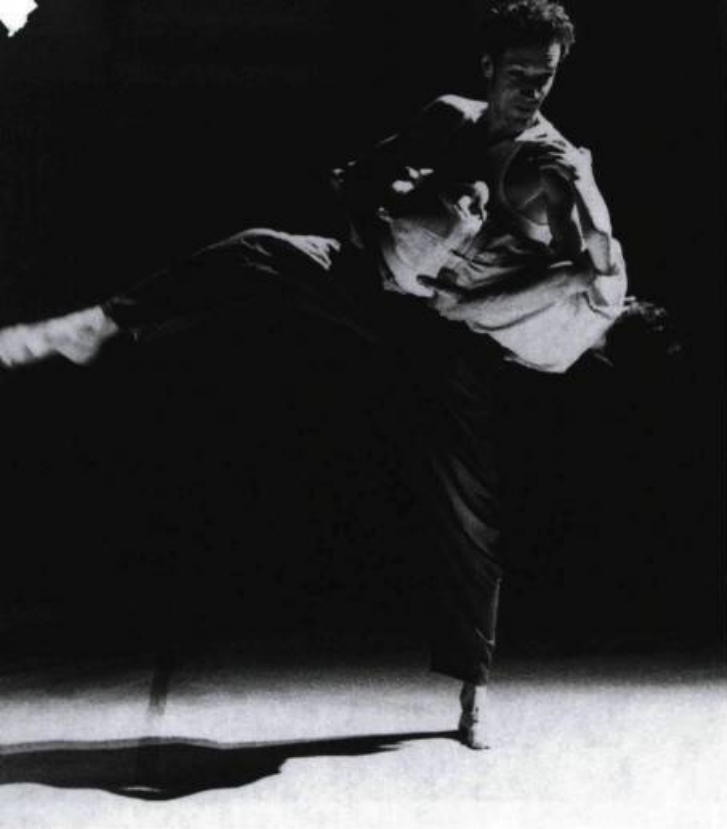
Entre ciel et terre, Compagnie du Sillage (France).

interprètes, jeunes et adultes accordés dans des mouvements simples, disposent leurs tracés harmonieux avec lenteur, concentrés à construire un monde de douceur et de beauté.