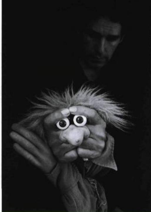
Les Petites Histoires, Teatro Hugo & Ines (Pérou).