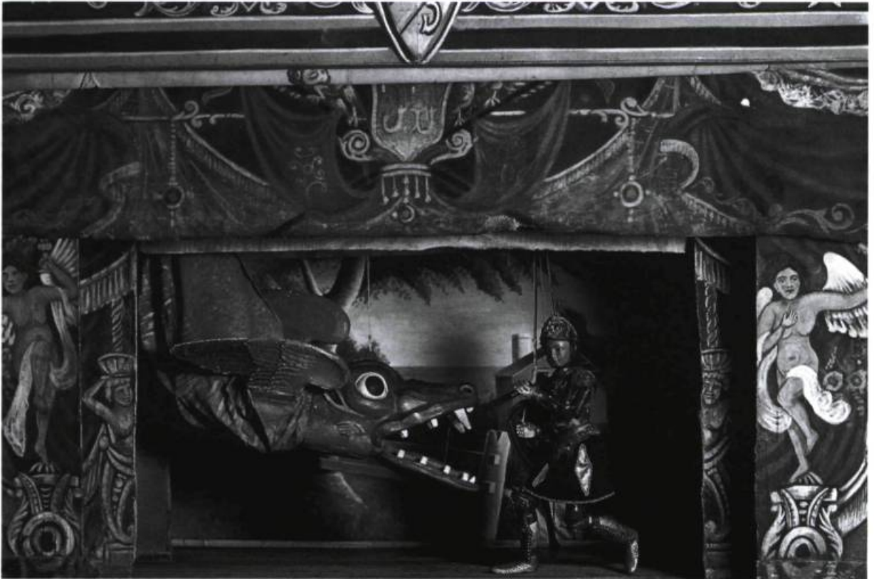
Le Siège de Paris , Teatro Arte Cuticchio (Italie).

Ces personnages colorés racontent l'épopée chevaleresque de Roland et de Renaud. Ils sont accompagnés de personnages comiques, issus de chansons de geste et du roman du roi Arthur, dont les aventures subissent des variations infinies. Le dialogue, improvisé en spectacle ici comme en Italie (on a pu s'en rendre compte, vu l'exiguïté du local imparti à Gaspare Canino d'Alcamo et, donc, notre proximité avec les