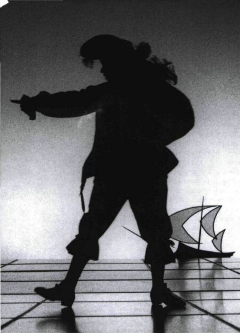
Les Fourberies de Scapin, mises en scène par Joseph Saint-Gelais au Théâtre Denise-Pelletier.

l'esclave et après lui le journalier, tel Matti, ou le contractuel au statut précaire de nos jours, appartient à la classe des fourbes, ce qui désigne moins une attitude caractéristique qu'une aptitude à « construire des machines ». Le fourbe se reconnaît à ses fourberies, cela va sans dire, ce qui n'est pas sans menacer l'ordre (social). Comment ignorer les trésors d'ingéniosité auxquels ont dû recourir, de tout temps, les domestiques, et ce jusqu'à leur descendance actuelle, plus répandue qu'on ne le croit – à des titres divers, mais c'est une autre histoire !