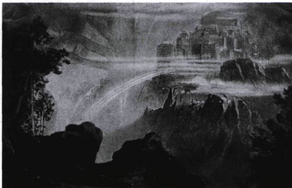
L'Or du Rhin , de Wagner. Bayreuth, 1876. Décor de Max Brückner.

se dérouler un débat important sur la possibilité même de la synthèse des arts, qui semblera aboutir sur la constatation que la musique pure se suffit à elle-même pour raconter, expliquer, dépeindre... Cet « idéalisme théâtral » se contenterait volontiers du concert, puisque le spectacle lyrique est décidément trop compromis par la représentation de la réalité « matérielle ».