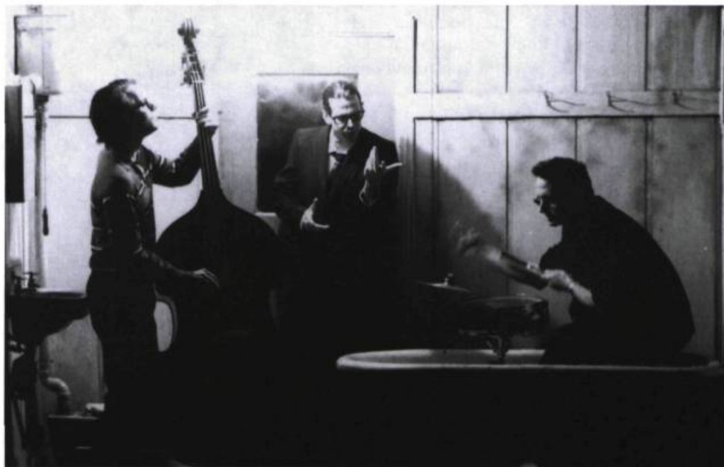
Les Sept Branches de la rivière Ota, Ex Machina.

Une même flamme sacrée brûlait Or de Pol Pelletier ; une flamme qui englobe les cultures, les fusionnant pour créer le grand œuvre, alchimie unificatrice et non pas synthèse simplificatrice. Pol Pelletier redonne sens au rituel, elle redéfinit les conditions de la représentation ; pythie en action sur son rocher, elle nous redonne conscience de notre corps d'acteur, de notre métal à découvrir. Ce message organique résonnait particulièrement en moi, qui venais de suivre la leçon inaugurale de Grotowski, au Collège de France, et qui travaille dans ce sens avec une compagnie ; trouver sa