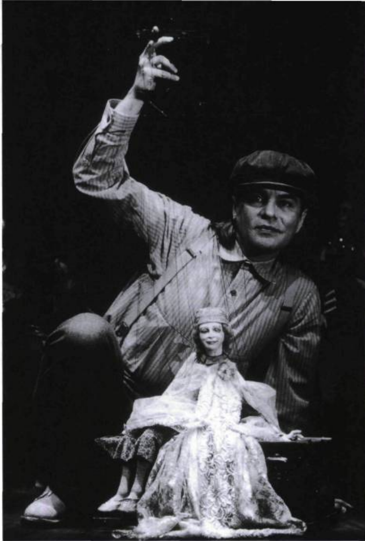
Tinka's New Dress, Ronnie Burkett Theatre of Marionettes.