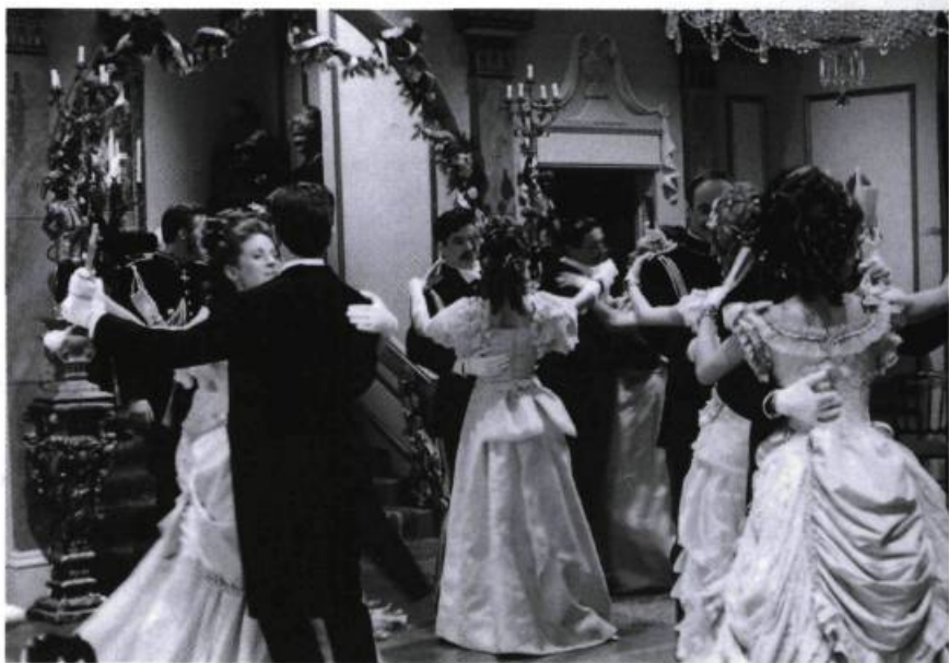
Anna Karénine (1988).

Est-ce que ça pose des problèmes pour un comédien de tourner, par exemple, l'acte I, puis l'acte III, pour finir avec l'acte II ?