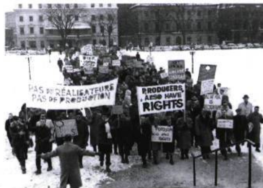
La grève des réalisateurs à Radio-Canada (Ottawa, 1959).

J. F. – En premier lieu vient le choix de la pièce ; et grâce à Dieu, à la télévision, nous pouvions monter ce que nous voulions, à condition que la pièce soit accessible au public. Au début, j'ai monté des Claudel, des classiques et aussi des œuvres plus accessibles. Le choix de l'œuvre est donc important ; il faut comprendre qu'il y a un très grand auditoire à notre disposition et se rappeler que la télévision n'est pas un théâtre d'essai. Ensuite vient la distribution, qui est capitale, puis le travail avec les comédiens qui est peut-être le plus important. J'ai beaucoup travaillé au théâtre, en parallèle. Avant la fameuse grève des réalisateurs, nous discutons notre contrat chaque année. Une année, au moment de cette discussion, j'étais déjà engagé comme metteur en scène pour toute une saison au Rideau Vert ; monsieur Ouimet, patron à Radio-Canada, commençait à vouloir me le reprocher. Je crois que je l'ai convaincu que ce travail au théâtre m'enrichissait, moi, dans mon travail