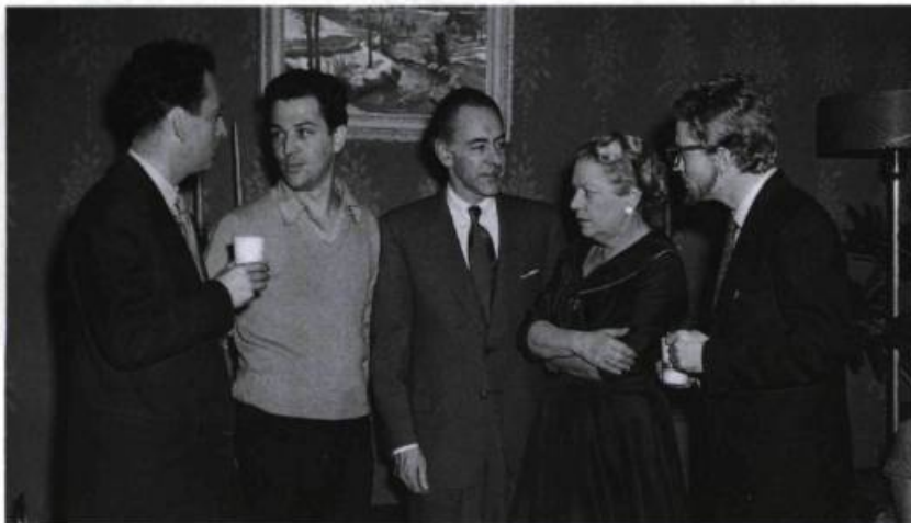
Quatuor (décembre 1955).

J. F. – Environ une centaine d’heures de répétition. Je viens de lire un livre sur Duras ; on y parle de son travail avec Madeleine Renaud dans Savannah Bay . Duras explique en long et en large ceci et cela ; Madeleine la laisse parler, et après, elle lui dit : « Bon, et maintenant, si on travaillait ? » C’est ma façon de voir les choses.