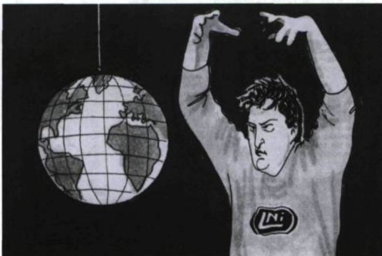
Illustration de Pierre St-Denis, tirée du Programme-souvenir de la 1 re Coupe du Monde d'improvisation, 1985, p. 9.

Mais là aussi, comme tout un chacun, il n'a pas su, pas pu, pas voulu sans doute être totalement fidèle à ses propres principes face à cette création iconoclaste, révolution-