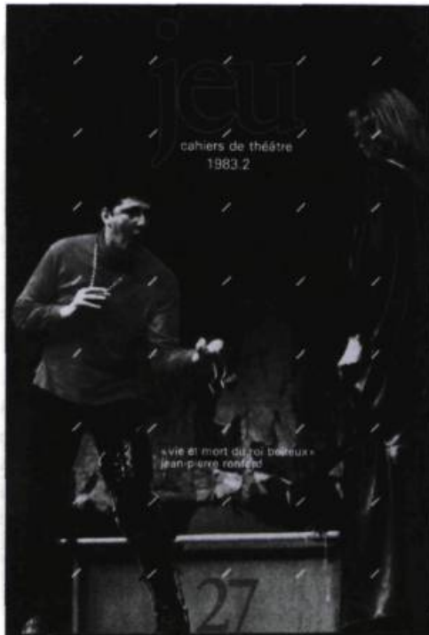
Vie et mort du Roi Boiteux (NTE, 1981).