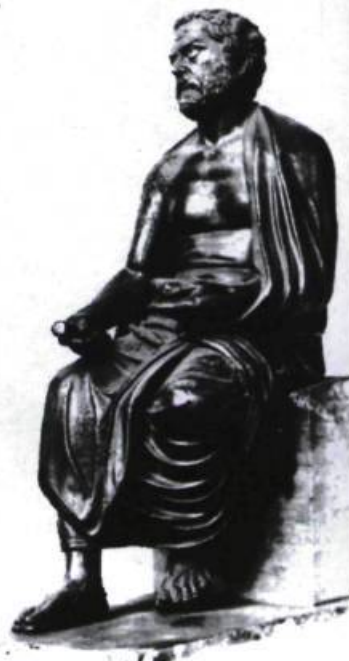
Sophocle. Bronze antique.