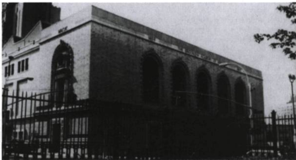
La tournée du spectacle de Patrice Chéreau, Dans la solitude des champs de coton, s'est arrêtée à New York, à la Brooklyn Academy of Music.

Connu du grand public new-yorkais pour ses films la Reine Margot et Don Giovanni , Chéreau renoue avec cette pièce le dialogue littéraire, fécond mais rare actuellement dans le sens Paris-New York, qui marquait naguère les relations transatlantiques. Au frémissement de la salle, on sentait parfaitement le choc de la représentation. C'est que la société