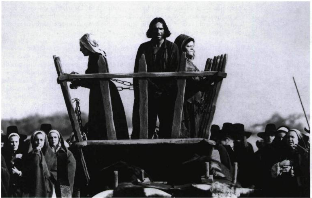
Une « scène biblique » du film The Crucible .

décrit comme une « putain » ou une « enfant gâtée », notamment dans une scène où Abigail s'introduit dans la geôle de Proctor pour lui offrir de s'enfuir avec elle. Absente de la pièce, cette scène éclaire de façon tout à fait neuve le personnage d'Abigail, et parvient presque à l'excuser à nos yeux de la monumentale supercherie qui a entraîné la condamnation et l'exécution d'innocentes personnes. Marginale dans cette société puritaine, certes sans morale, Abigail apparaît moins comme un monstre – la femme tentatrice de la version scénique – que comme une femme passionnément, pathétiquement amoureuse. Venant après le procès où était soulignée la fausseté d'Abigail, cette scène ramenait à l'avant-plan la passion qui la dévorait.