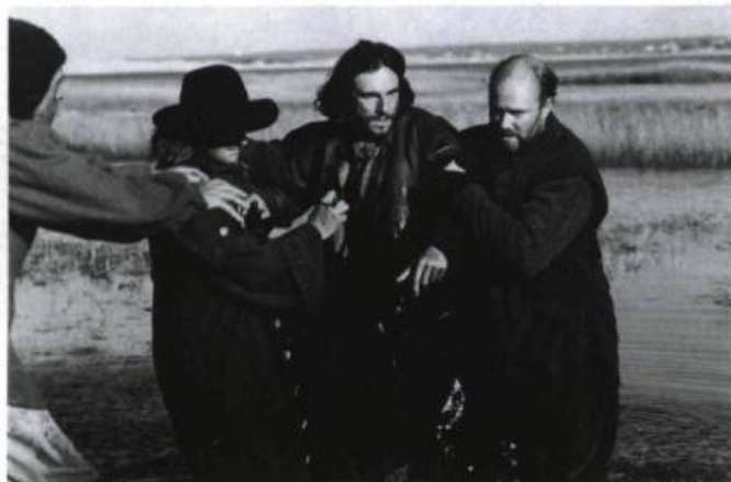
John Proctor (Daniel-Day Lewis) est arrêté pour sorcellerie.

Bien sûr, il aurait été étonnant que le film de Nicholas Hytner ( La Chasse aux sorcières/The Crucible 2 ) ne braque pas l'éclairage sur le personnage de Proctor ; mais c'est un être « illuminé » que nous découvrons au grand écran, baignant dans une aura de dignité. J'entends d'ici hurler les puristes contre les diktats d'Hollywood, qui exigent