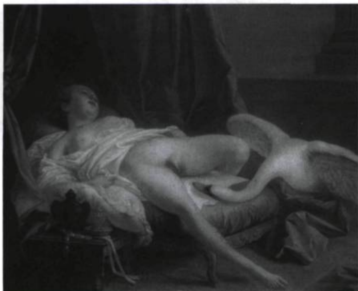
Boucher, Léda . Huile, coll. particulière.