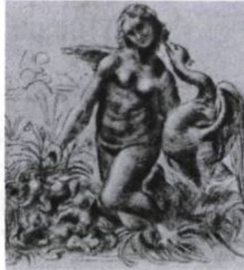
Léonard de Vinci, Étude pour Lédà agenouillée (1504-1506).

De fait, dans le conte d'Andersen, le caneton manqué se trouve égaré dans un monde qu'il ne comprend pas et qui lui rend la pareille. Il refuse néanmoins de se soumettre à des lois incompatibles avec celles que lui dicte sa conscience. Fidèle à lui-même, il