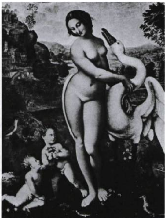
Copie de Léda debout de Léonard de Vinci (1504), attribuée à G. Bugiardini.