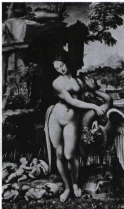
Copie de Léda debout de Léonard de Vinci (1508), attribuée à Francesco Melzi.

qui s'occupe d'elle en mère, en ami, en mari, en amant, malgré sa vie conjugale avec une autre qu'il accepte même de quitter pour épouser sa maîtresse. Pourtant, à la fin de la pièce, Dora n'endosse pas la robe de mariée offerte par Kevin pour se marier avec lui, mais pour rejoindre Bill revenu la chercher après avoir été « égaré » au loin par l'amant jaloux. En résumé, telles sont les difficultés qui écrasent l'héroïne, écartelée entre les exigences du travail, les tiraillements de la conscience et les impératifs de l'amour. Et voici maintenant comment le cygne tombé du ciel allège le poids de ses peines en la guidant sur le chemin tortueux de la quête de soi.