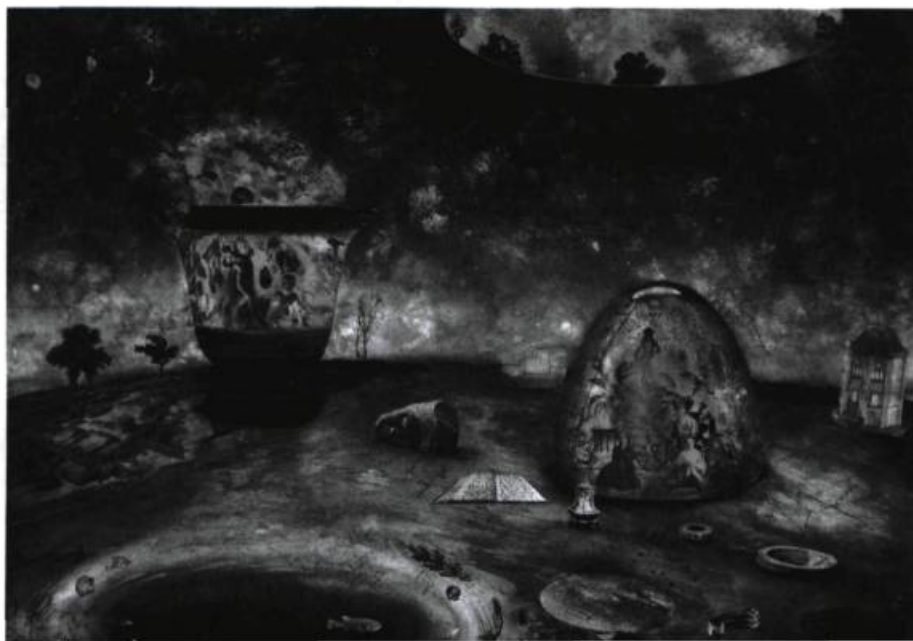
J.W. Stewart, Bell and Jar , 1995. Techniques mixtes, 102 x 137 cm.

Mon amour, puisqu'il faudra vous quitter une dernière fois, le plus lentement possible, une dernière fois, sur l'envers du rideau, de l'encre de mes cendres je tracerai : « Je vous aime. »