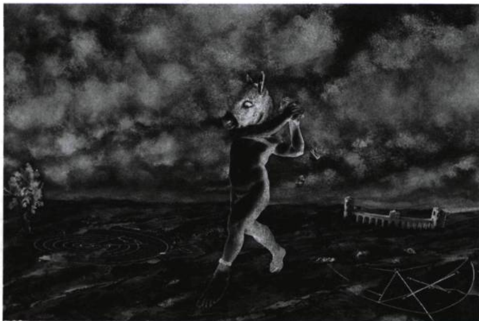
J.W. Stewart, Bottom , 1994. Techniques mixtes, 35,5 x 52 cm.