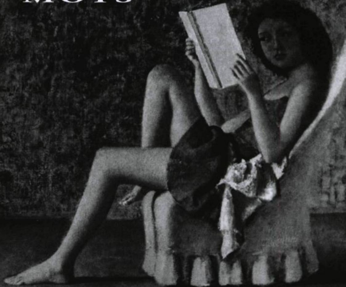
Balthus, Katia lisant, 1968-1976. Huile sur toile, 179 x 270,7 cm. New York, collection privée. tirée de Balthus à la Biennale de Venise, Venise, Edizioni « La Biennale di Venezia », 1980, p. 65.