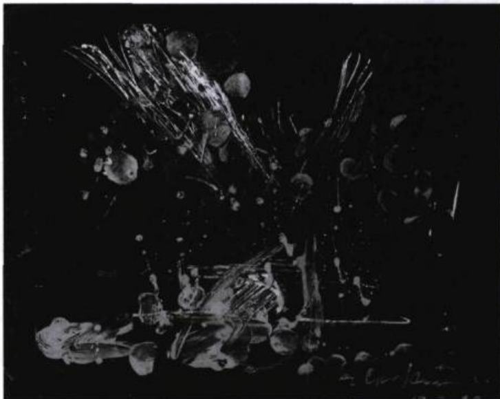
« Frémissement avant le final ». Peinture-maquette de Serge Ouaknine pour le Feu d'artifice n° 1.