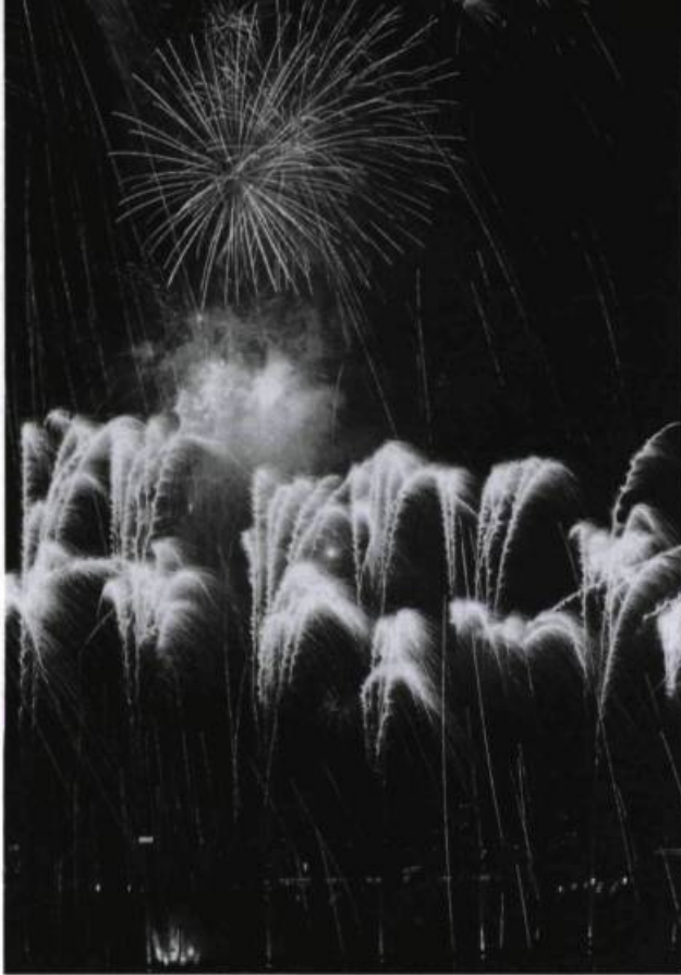
Feu d'artifice n° 1 , parc de la Villette (Paris), 1992. Conception de Serge Ouaknine.

Toutefois, je n'ai pu m'empêcher de déborder sur les couleurs, par plaisir et par ironie. Car il faut bien qu'à des moments lyriques monochromes des envolées quasi spirituelles apparaissent, des moments de jubilation tellurique. Quand il eut regardé longuement mes maquettes, Marc Jaumot se contenta de supprimer deux dessins et d'inverser l'ordre de deux autres. Ce fut tout. Mais la leçon fut pour moi d'une grande éloquence. Il avait d'une part coupé une redondance et, d'autre part, par une simple inversion, créé un changement de rythme.