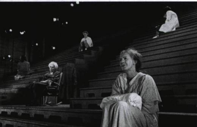
Albertine, en cinq temps , Espace GO, 1995.

escalier, une chandelle à la main, suffisait à Pol Pelletier dans Joie à installer sa présence d'actrice pour que nous la suivions attentivement dans ses moindres gestes tout au long de la représentation. Dans le travail qu'a effectué Gregory Hlady sur l'œuvre de Kafka, Amerika , les acteurs, dont lui-même, étaient des acrobates aux prouesses physiques étonnantes. Ce metteur en scène semble considérer l'acteur comme une surmarionnette, à la façon de Gordon Craig, c'est-à-dire comme un être qui se définit exclusivement par ses actions sur scène. L'originalité de cet acteur-metteur en scène est tonifiante. Chez Carbone 14, dont la Forêt a été pour moi une des plus