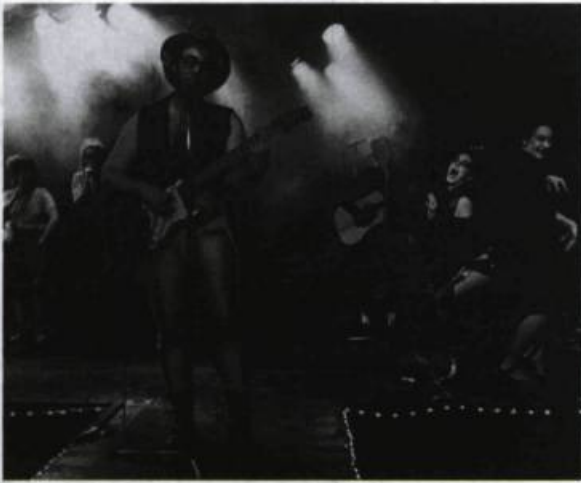
Cabaret neiges noires, Théâtre Il Va Sans Dire/Théâtre de la Manufacture, 1994 (reprise).