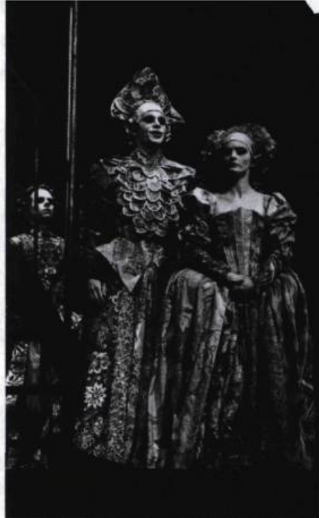
Le Songe d'une nuit d'été , TNM, 1988.

1995 – Albertine, en cinq temps , Espace GO Le Temps et la Chambre , Théâtre du Nouveau Monde