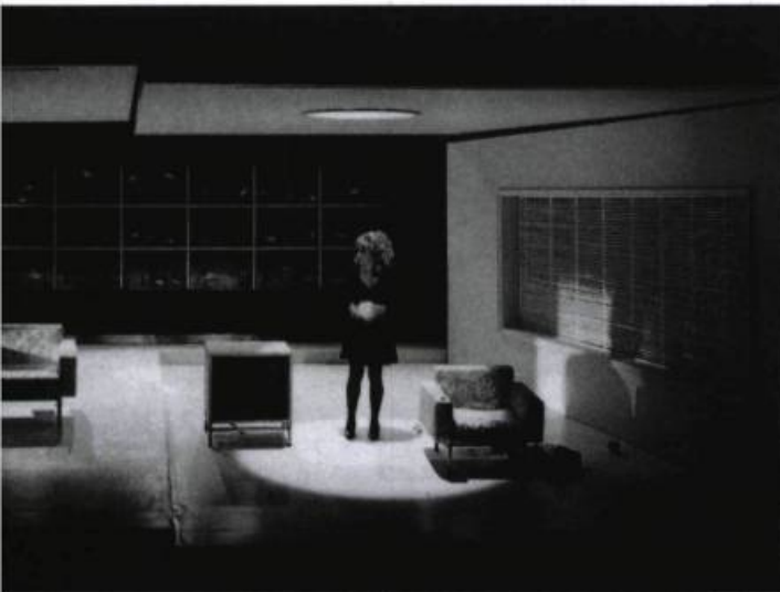
HA ha !..., TNM, 1990.

que, dans un autre contexte, l'éclairage lunaire de la Forêt de Gilles Maheu. J'avais apprécié cette interprétation originale de Serge Denoncourt, qui avait réussi à briser les clichés entourant ce grand mythe amoureux en mêlant l'ancien et le moderne, l'intelligence et le cœur. Chez Carbone 14, le désir amoureux trouvait toute sa force dans