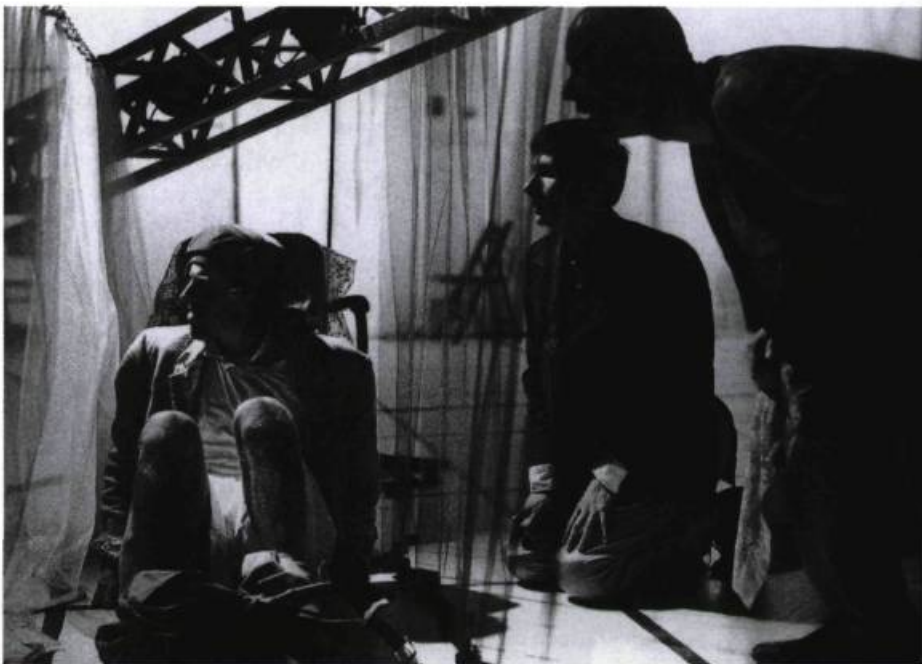
Amerika , Groupe de la Veillée, 1992.

Contrairement à d'autres spectateurs qui extériorisent pleinement leurs émotions, mes réactions au théâtre sont assez peu visibles. Mais il y a eu deux exceptions marquantes : aux Ubs , où je me suis presque étouffé de rire devant une Mère Ubu interprétée