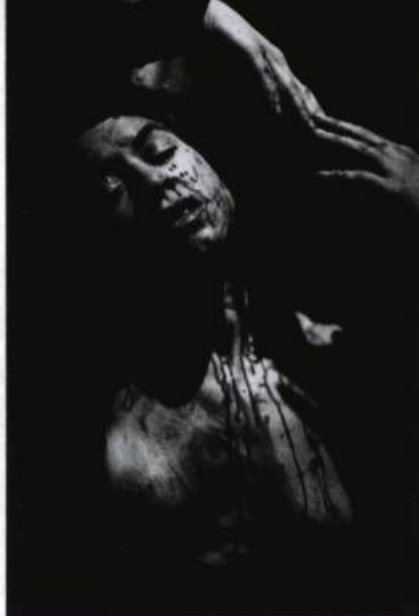
La Forêt , Carbone 14, 1994.

par un Carl Béchard méconnaissable, et Cabaret neiges noires où je me suis étonné moi-même à crier pendant le spectacle, participant au brouhaha général causé par une salle en délire. Le travail du Théâtre UBU m'a fait retomber en enfance, comme celui du Théâtre Il Va Sans Dire m'a fait retourner à l'adolescence parce que, dans les deux cas, j'avais perdu toutes mes résistances pour me livrer à une ivresse vraie.