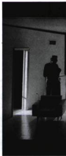
À propos de Roméo et Juliette , Théâtre de l'Opis, 1989.