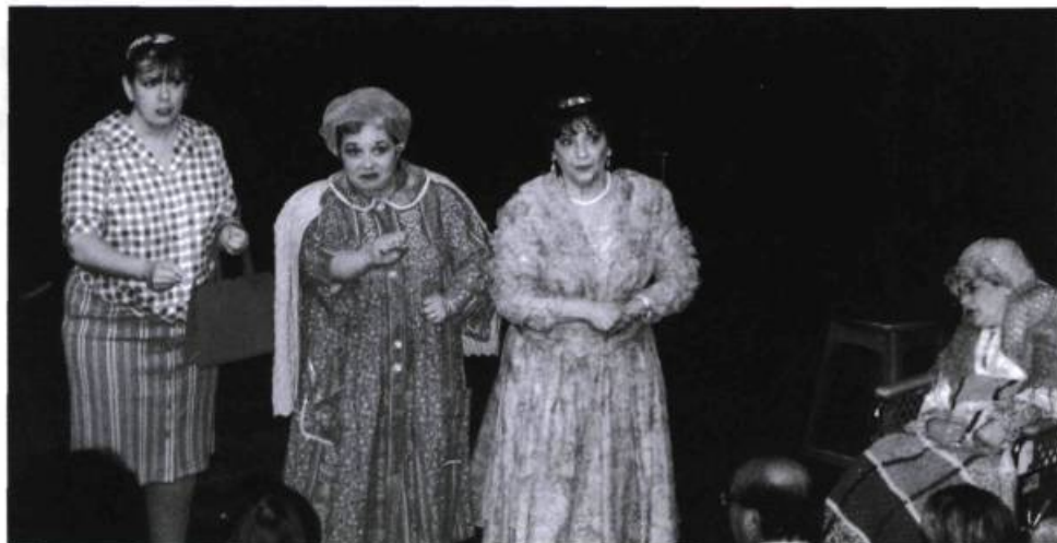
L'« Ode au bingo » en yiddish.