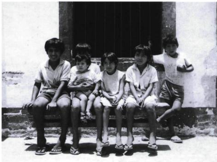
Les enfants du Pérou.

1990... Le temps continue à passer. Je demande une bourse d'écriture. Cette fois, c'est sérieux. Je n'arrive plus à me concentrer sur autre chose que ces visages d'enfants du Sud devenus des adultes responsables de leur repas du soir. Je veux comprendre comment ils ont réussi à garder leur regard curieux et émerveillé, qu'on dit appartenir à l'enfance. Je ne sais ni où ni comment nos enfants comblés et surprotégés ont perdu ce regard. Je reçois la bourse. Je plonge. Pas dans l'écriture. J'en serais incapable... Les questions se bousculent au portillon. Je plonge avec les enfants à la recherche de leur point de vue à eux sur le Sud.