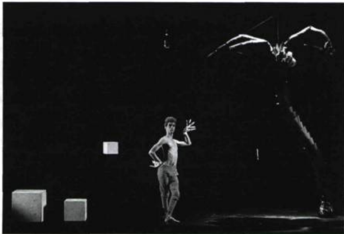
Acte sans parole I, Troupe Cité (1984).