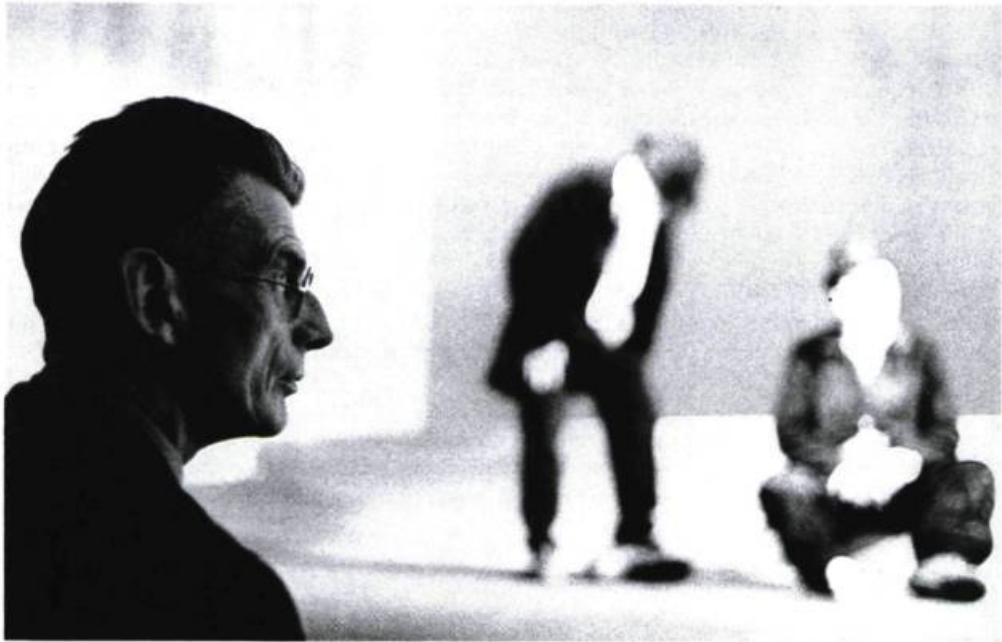
Samuel Beckett, En attendant Godot, 1961.