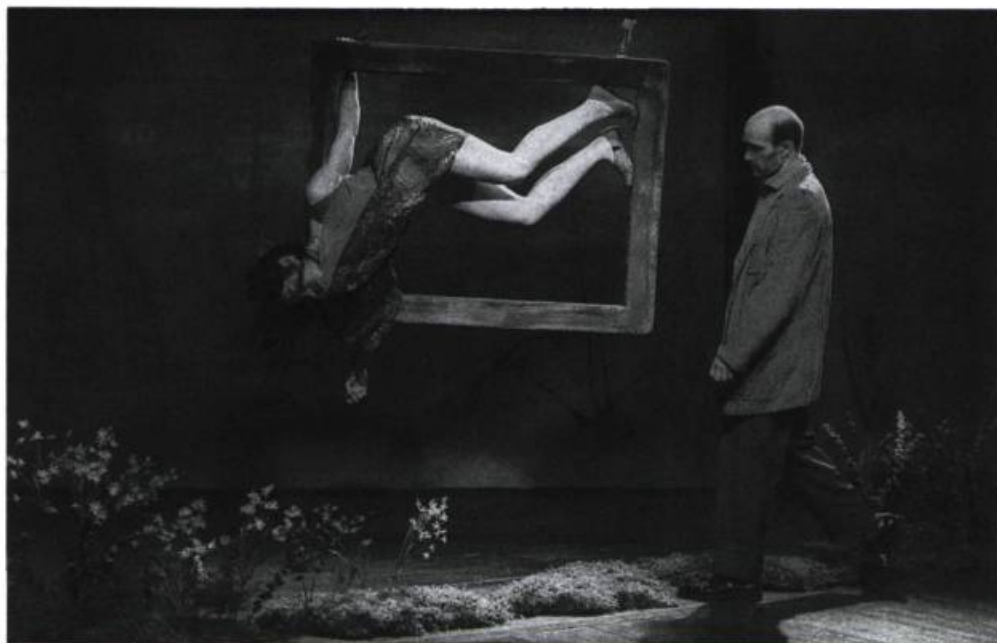
Peau, chair et os : «la femme est jusqu'au-dessus des genoux dans le néant, amputée par le cadre, ou bien surgit-elle du sol comme l'homme sort de la maison et y disparaît-elle comme l'homme dans la maison, jusqu'à ce que s'ensuive ce mouvement continu qui fait sortir du cadre, le vol, la propulsion [...]».