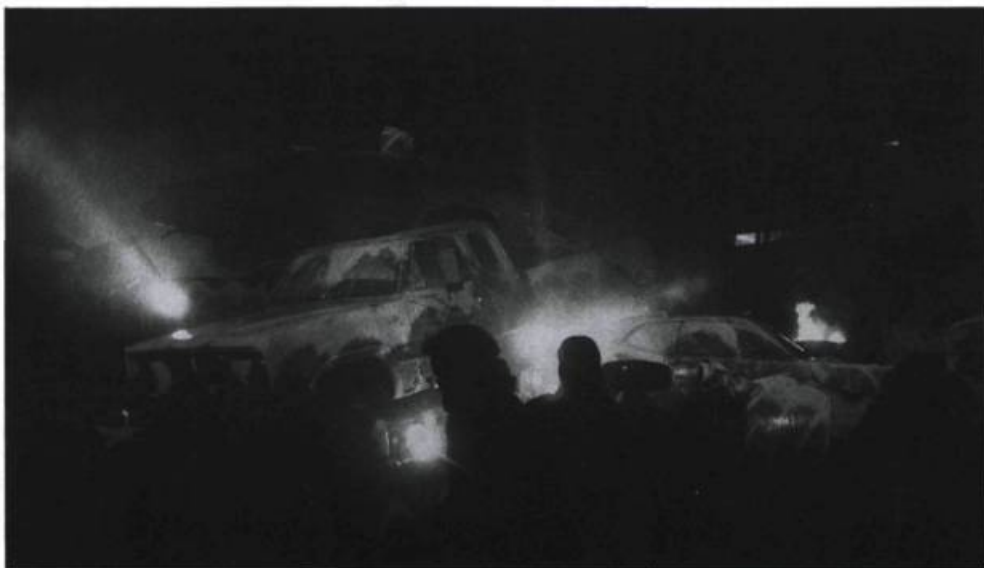
Le Titanic , «créé dans un cimetière de voitures».

descriptions cliniques de la douleur), détresse intime, souffrance et libido, élargissant ces motifs privés à des proportions collectives et conjuguant de la sorte malaise social, horreur guerrière et frénésie adolescente : le Dortoir mettra en scène des êtres que l'éveil du corps, dans l'apprentissage du plaisir comme dans celui de l'agonie, occupe totalement, et dont l'élan, s'il règle des comptes avec une génération et ses idéaux, porte également une force et un dynamisme capables d'enluminer le présent.