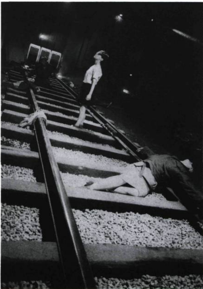
« Le Rail (voie ferrée traversant trente tonnes de terre) [...] est demeuré pour plusieurs le choc d'un environnement déstabilisant.»

Maheu écrit directement dans l'espace, le lien est forcément étroit entre «l'emballage» universellement admiré de ses créations et leur contenu thématique : les deux s'élaborent en même temps et ont la même finalité. Et toute esthétique ne comporte-t-elle pas une pensée? Pour le Rail , Maheu travaillait sur un élément (la lumière) intimement lié à la substance même (la psychanalyse) des œuvres dont il s'inspirait (sans compter le lieu de passage symbolique qu'incarnait la voie ferrée et la «traversée du tunnel» qu'y effectuaient les protagonistes); le sectionnement en cadres de Pain blanc accusait le fractionnement social que dénonçait le spectacle; le lyrisme de l'Homme rouge accompagnait naturellement cette réflexion sur l'héritage effectuant un détour par l'enfance; quant au Titanic , son esthétisme ambigu soutenait la grandiloquence affectée de son propos. Et puisque le corps règne, chez Carbone 14, les préoccupations thématiques de Maheu, découlant de cette primauté, articuleront désir et blessure (les postures du corps dans l'Homme rouge s'inspiraient de