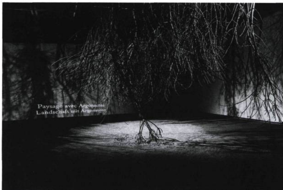
Rivage à l'abandon. «Les trois salles d'exposition (chacune correspondant à un acte de la trilogie) menant au spectacle lui-même présentaient un squelette scénographique inspiré des textes et comprenant des extraits de ces derniers.» «La troisième salle contenait une forêt d'arbres morts tombant du plafond, ou le paysage renversé.»

derniers 5 , tandis que le hall central rassemblait des vestiges de tous ordres, y compris des traces de spectacles précédents de Carbone 14. Par Jason, être itinérant en quête perpétuelle d'un mirage, par Médée, charnelle et révoltée, et par les Argonautes, dont le long périple contient tous les récits de voyages et de conquêtes subséquents, Maheu se rapprochait à son tour de la tragédie, laquelle raconte invariablement l'histoire d'une exclusion — le cœur lui-même, dans sa mise en scène, se composait d'éléments marginaux par rapport à l'État : femmes, vieillards. La distribution du spectacle mêlait professionnels et amateurs, chanteurs et acteurs, liant en outre les générations et les ethnies; les seize figurants, âgés de douze à quatre-vingt-quatre ans, qui, errants ou guerriers, entouraient les actrices, s'inscrivaient ainsi dans un discours théâtral qu'ils subvertissaient de tout le poids, émouvant, de la réalité.