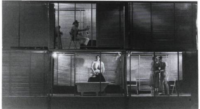
Pain blanc : «ballet déchaîné au centre, cases symétriques au fond». «Le sectionnement en cadres [...] accusait le fractionnement social que dénonçait le spectacle.»