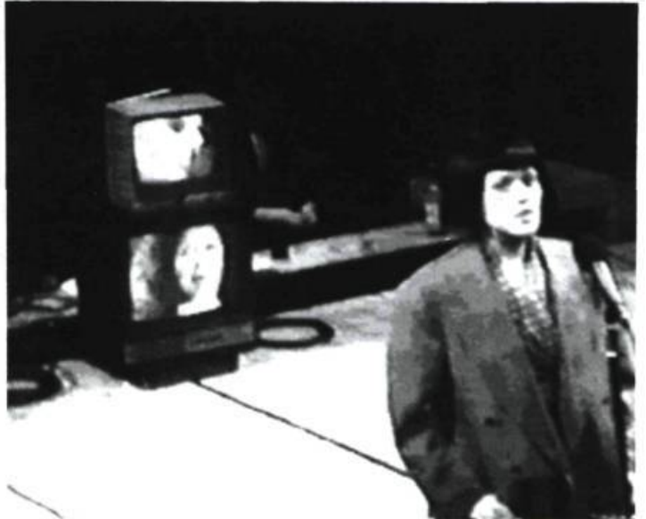
1. Note de la metteuse en scène (je traduis).

Le méta-humour du Wooster Group permet difficilement d'éclater de