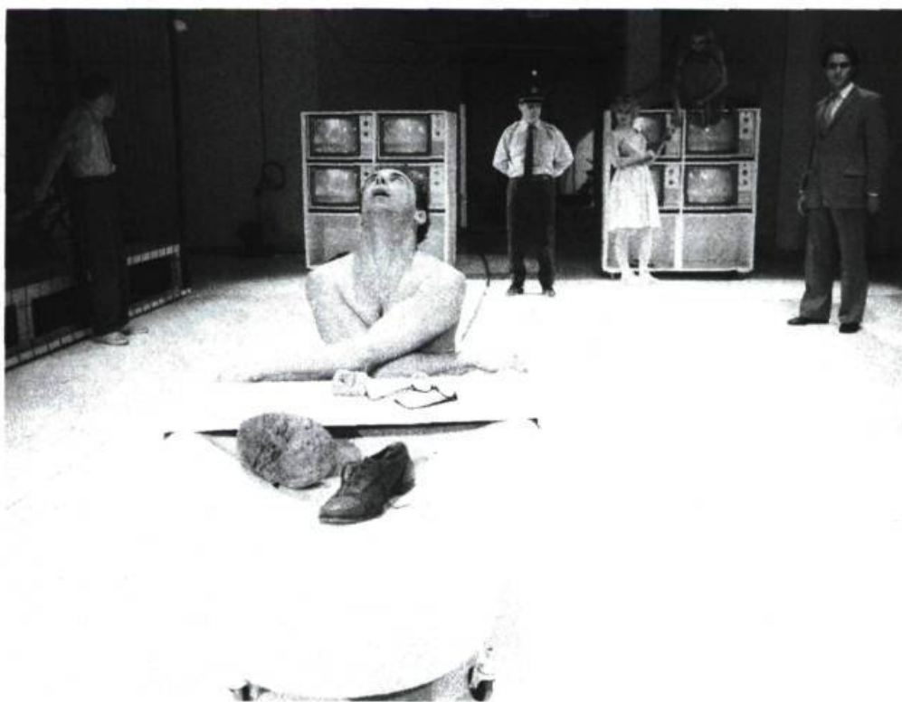
Marat-Sade de Peter Weiss, mis en scène par Lorne Brass en 1984.