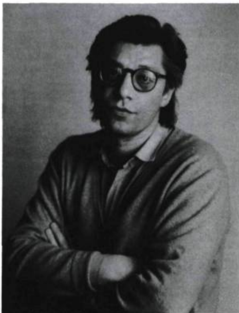
Botho Strauss.

Visiteurs; la Chambre et le Temps ( Besucher, Die Zeit und das Zimmer ), Paris, l'Arche, 1989, 134 p.