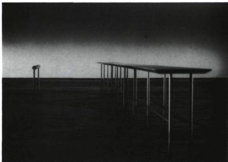
Décor de Robert Wilson pour la scène 6.

Par l'utilisation royale de la meilleure technologie scénique qui soit, il sait donner à l'espace et à la lumière qui s'y meut une autonomie souveraine. Ses dessins préparatoires 12 (selon moi fortement influencés par l'œuvre d'E.G. Craig) montrent toujours le plateau vide, sans silhouette humaine. Cette curieuse désertion de l'acteur donne aux images un caractère irréel, abstrait, une géométrie qui pourrait être aussi bien microscopique que macroscopique. Parfois un élément isolé — ruine du