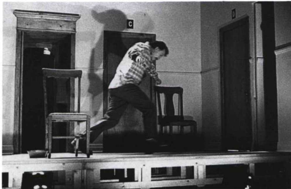
Le décor de la maison de chambres «est inclu[s] dans l'espace de la scène, un peu comme [...] une maquette qui serait à taille d'homme.»