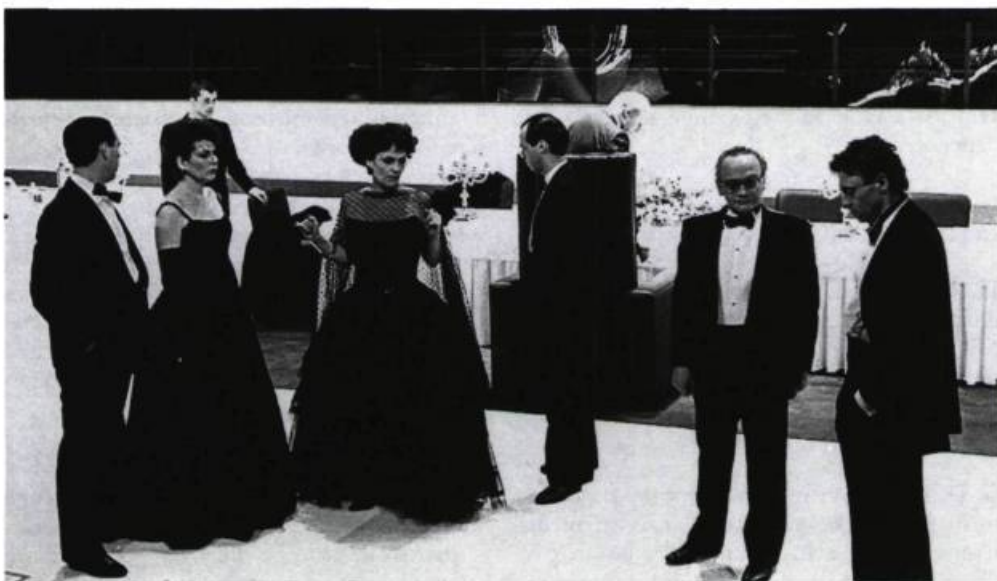
Le Printemps, Monsieur Deslauriers de René-Daniel Dubois à la Compagnie Jean-Duceppe : la thématique homosexuelle n'y était pas assez évidente pour qu'on puisse voir dans l'accueil favorable que la pièce y a reçu un signe de plus grande tolérance face à l'homosexualité.

So. L. — J'aimerais revenir sur un point qu'a soulevé Gilbert : pourquoi l'homosexuel sent-il le besoin de recréer le climat d'opposition? Cela ne tiendrait-il pas au climat de tension qui existait dans la famille d'origine et duquel le désir