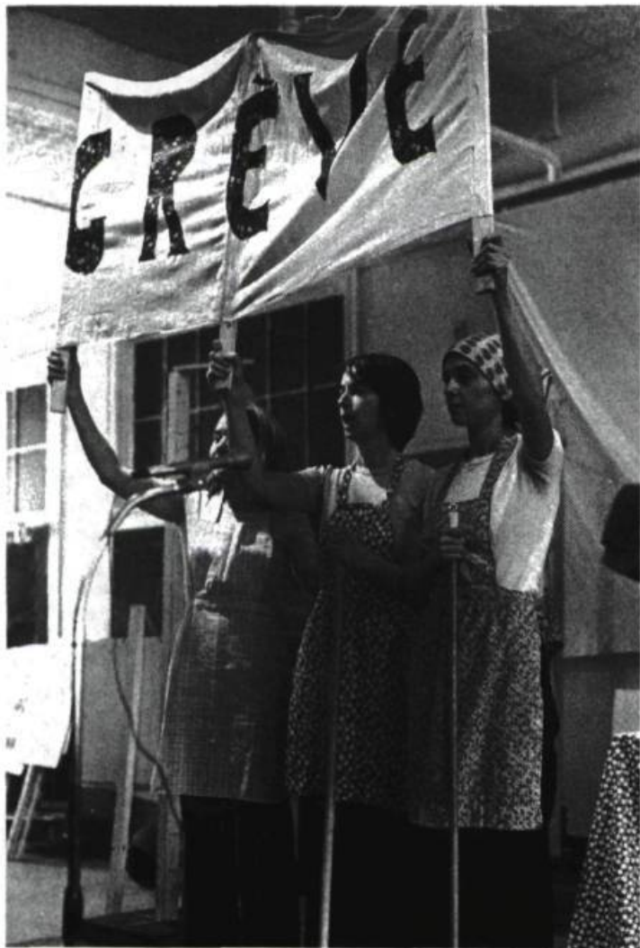
Le discours qui était tenu dans le théâtre féministe d'une certaine époque était-il moins universel que ne l'est celui du théâtre gai actuel? Maman travaille pas, a trop d'ouvrage du Théâtre des Cuisines.

thématique homosexuelle dans cette pièce. J'avais bien sûr été frappé par le personnage du petit-fils, mais la lecture de la pièce m'a permis d'y porter plus d'attention encore. Je pense bien que le public chez Jean-Duceppe n'a pas davantage vu l'importance de l'homosexualité dans cette pièce. Je crois donc, comme Alexandre, qu'il ne faut pas penser, à partir du nombre de pièces gaies, que le public montréalais est devenu très tolérant vis-à-vis des homosexuels. Ce n'est pas un signe. Cela dit, je me demande encore, moi aussi, pourquoi ce théâtre passe bien. On établit volontiers, comme Alexandre tout à