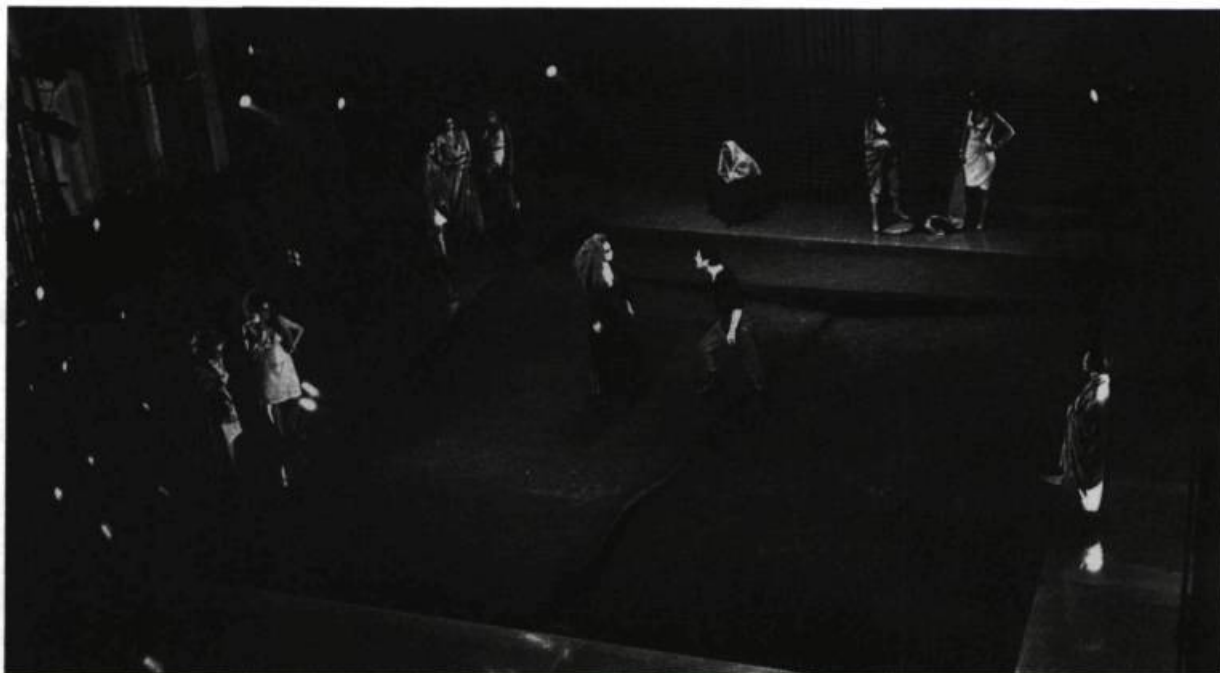
La Médée «presque misogyne» du T.N.M. Spectacle de Marie Cardinal, mis en scène par Jean-Pierre Ronfard.