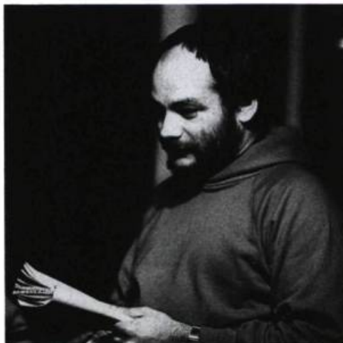
«C'est [...] la crédibilité de Brassard qui a permis le succès de beaucoup de pièces à thématique homosexuelle.» (Stéphane Lépine)

G. D. — La société québécoise a actuellement