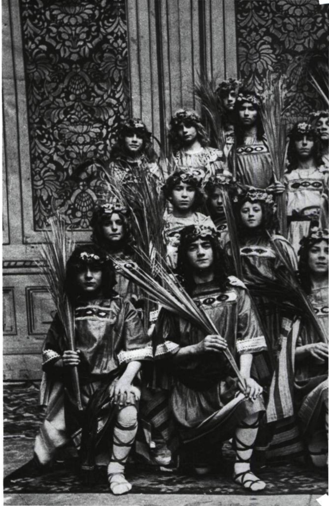
Les chœurs d' Atbalie , Montréal, 1947. Photo : Henri Paul, Archives publiques du Canada, PA 160556.