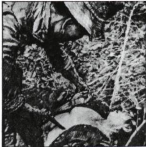
Peter Sorge, Elle arrivait difficilement à comprendre son bonheur , crayon de couleur et crayon, 1974. Tiré de Formes du réalisme aujourd'hui , Musée d'art contemporain de Montréal, 1980.