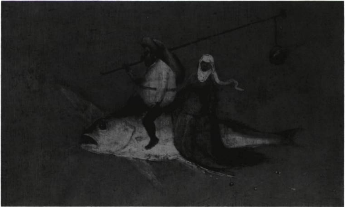
Détail de «la Méditation de saint Antoine», dans le Triptyque de la tentation de Jérôme Bosch, 1505-1506. Deux démons volant dans le ciel de la toile.