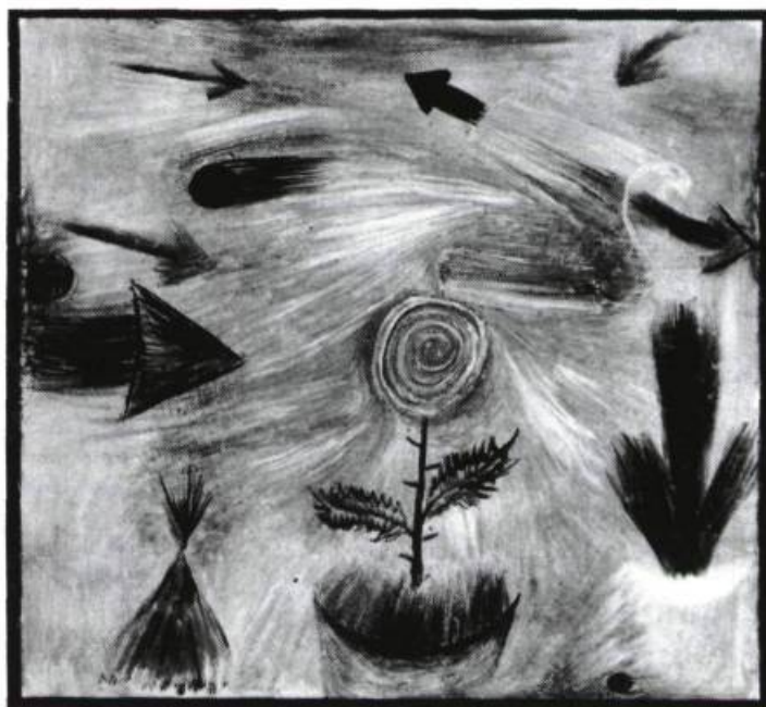
Paul Klee, The Wind of Roses , 1922.

Dans les exemples choisis plus haut, aucun spectacle ne tente d'illustrer ou de démontrer quoi que ce soit, chacun s'emploie à faire sentir et éprouver. Aucun ne propose une image littérale, tous travaillent plutôt avec des images qui font image. La participation du spectateur s'en trouve transformée; il devient actif, ses pulsions sont suscitées, et non plus sa sensibilité ou son entendement seuls. Ce théâtre-là est au théâtre «ordinaire» ce que la poésie est à la prose. Sans être meilleur ni supérieur (il ne s'agit pas ici de porter un jugement de valeur), il agit de façon différente; il provoque la grande communion dont le théâtre peut se rendre capable, ce miracle fugitif qui donne à un groupe de personnes étrangères les unes aux autres l'impression délicieuse de se rejoindre et d'être comprises, à travers l'expérience qu'elles partagent des mouvements