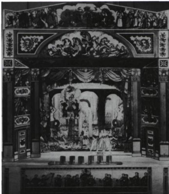
Théâtre miniature en carton, construit au XIX e siècle, en Angleterre, par Benjamin Pollock.

du public, il établit avec ce dernier de nouveaux liens, le dompte par la qualité de sa «présence» autant que par le faste de son costume; aux XVII e et XVIII e siècles, les comédiens s'habillent à même leur garde-robe personnelle, sans nul souci de vraisemblance historique: seul compte l'apparat. La voix est travaillée, l'envoûtement se raffine.